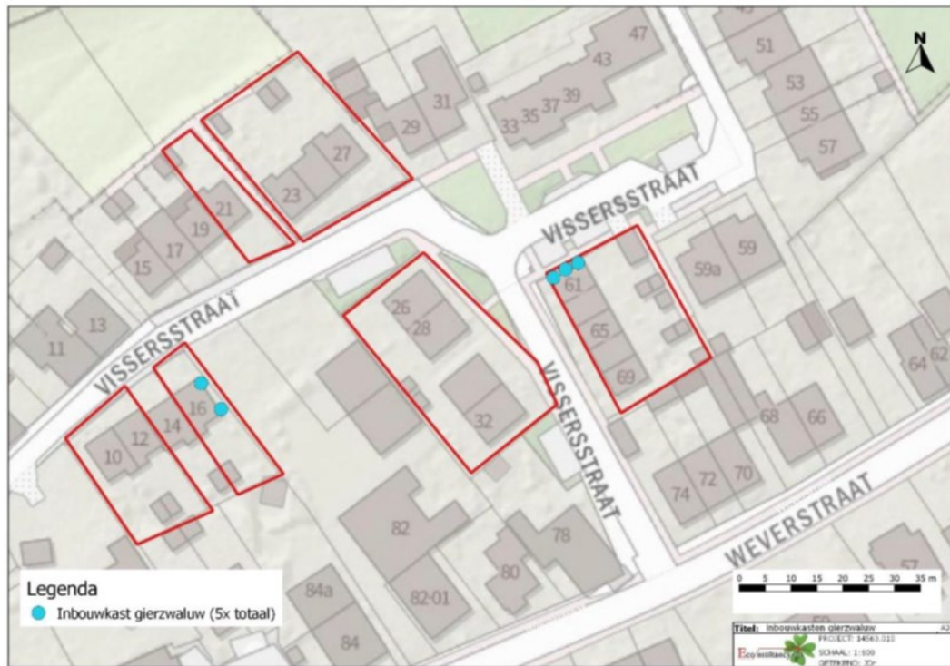
Figuur 3. Locaties inbouwstenen gierzwaluw.