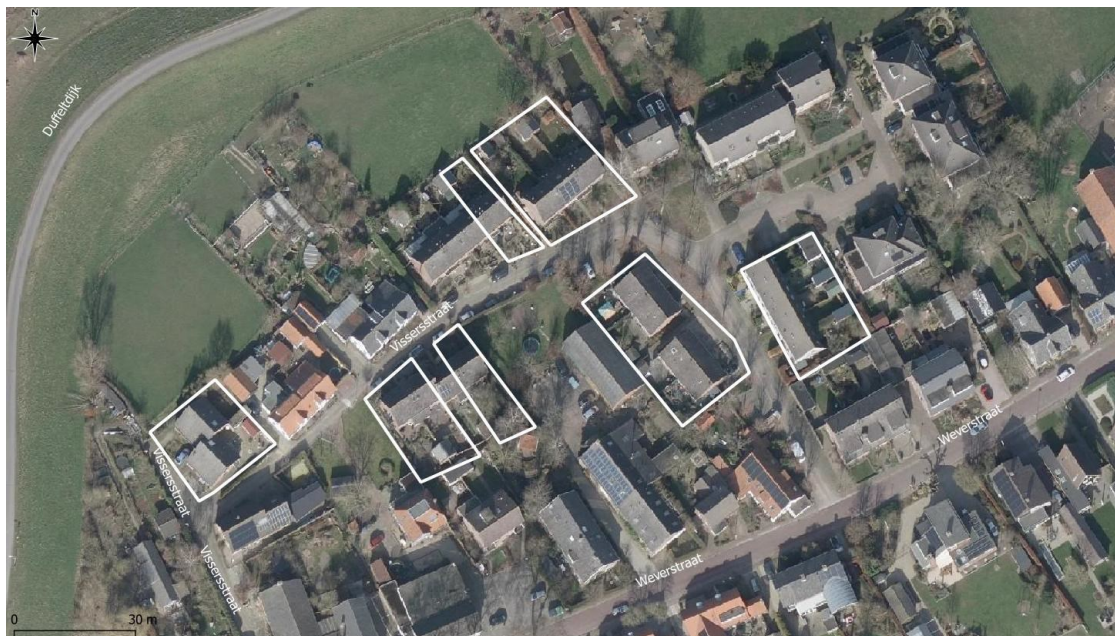
Figuur 2. Luchtfoto projectgebied (witte kaders).