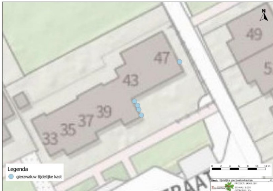
Figuur 2. Locaties tijdelijke gierzwaluwkasten.