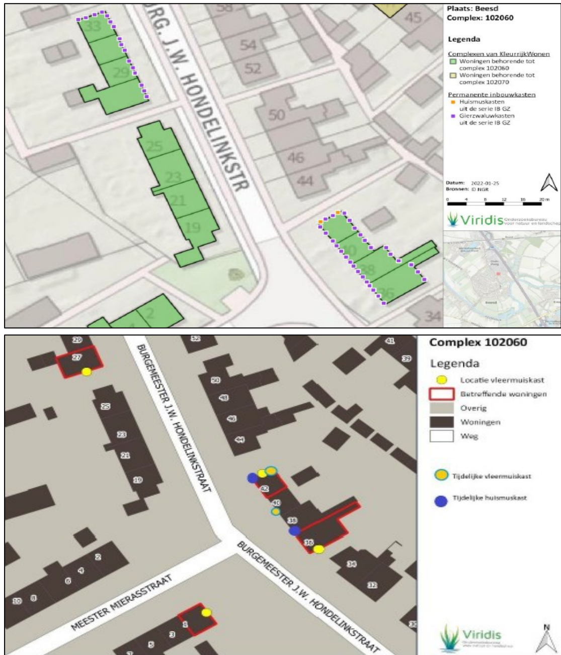
Figuur 2. De locaties van de tijdelijke en permanente voorzieningen voor huismus, gierzwaluw en gewone dwergvleermuis. De bovenste afbeelding weergeeft de locaties van de 45 inbouwkasten voor gierzwaluw (paars) en 2 voor huismus (oranje). Op de onderste afbeelding zijn de tijdelijke en permanente voorzieningen voor gewone dwergvleermuis weergegeven.