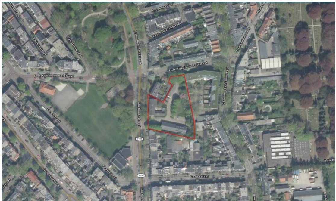
Figuur 1: Plangebied binnen rode kader (Van Vreeswijk, Maas, 2021)