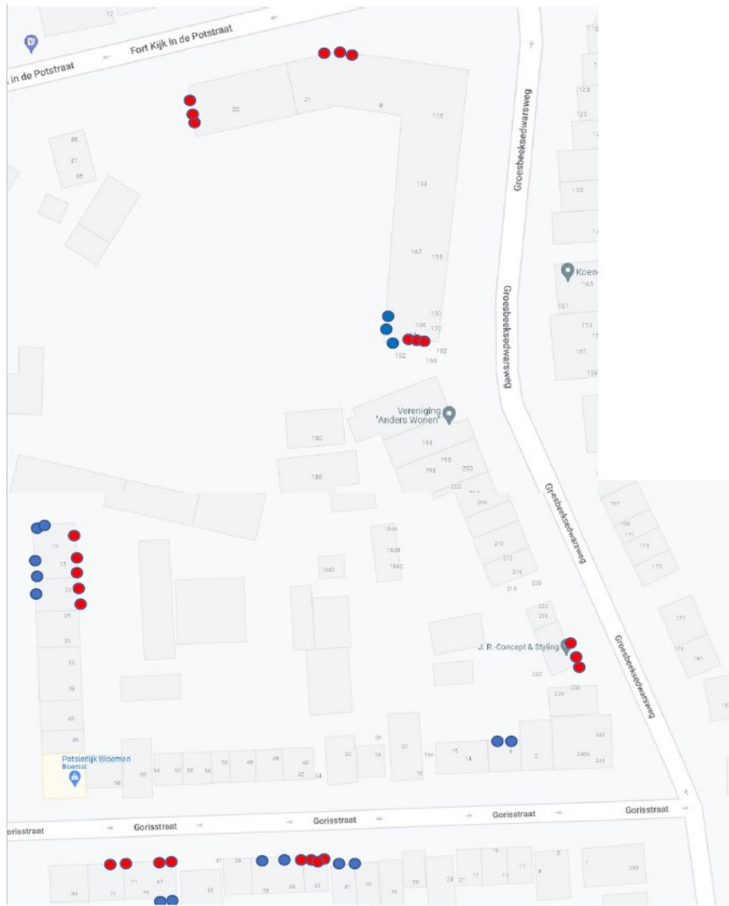
Figuur 2: locaties tijdelijke kasten. Met blauw zijn de locaties van de vlermuiskasten weergegeven en in rood de gierzwaluwkasten (Willems, 2022)