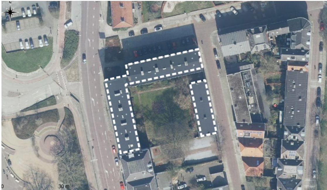
Figuur 1: plangebied binnen witte stippellijn (De Haas, 2022)