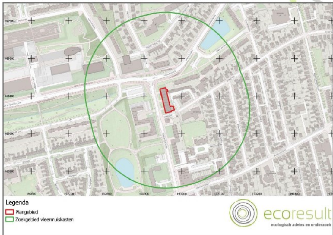
Figuur 1. Zoekgebied tijdelijke vlermuiskasten. Nadat de kasten zijn opgehangen wordt de locatie hiervan verstrekt aan de provincie Gelderland.