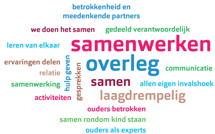
Figuur 3 Word Cloud VVE netwerkbijeenkomst december 2021

Met de betrokken partners is tijdens de VVE netwerkbijeenkomst gesproken over het thema ouderbetrokkenheid/ouderparticipatie. Hierbij is de voorkeur uitgesproken voor de term 'samenwerken met ouders'. Dit is een makkelijke bewoording en hierdoor voor iedereen herkenbaar. Het geeft ook duidelijk aan wat het doel is: het samenwerken met ouders rondom hun kind(eren). De volgende wordcloud is gemaakt tijdens de bijeenkomst: