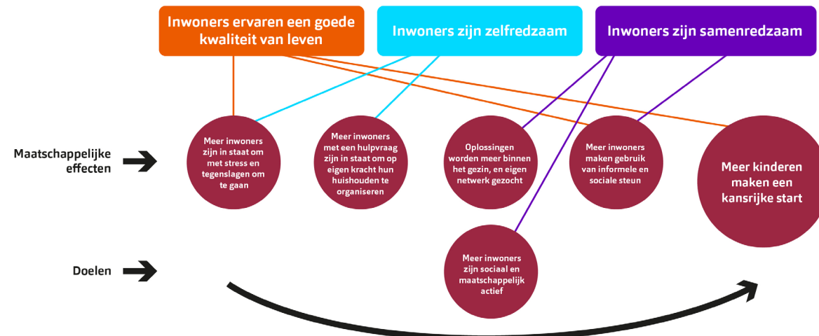
Figuur 1: Veerkracht in het Integraal Beleidskader Sociaal Domein Krimpenerwaard

'veerkracht'. De relevante doelstelling die hieronder ligt, is 'meer kinderen maken een kansrijke start'. Dit wordt weergegeven in figuur 1. Tevens sluit het programma aan op het thema 'gelijke kansen' van de Lokaal Educatieve Agenda (LEA) Krimpenerwaard.