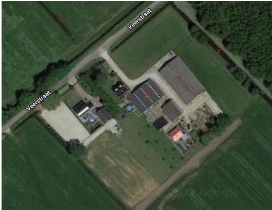
Figuur 2. Luchtfoto van het projectgebied met 1) de te slopen voormalige rundveestal, 2) de te behouden schuur en 3) de watergang waarlangs een natuurvriendelijke oever wordt aangelegd.