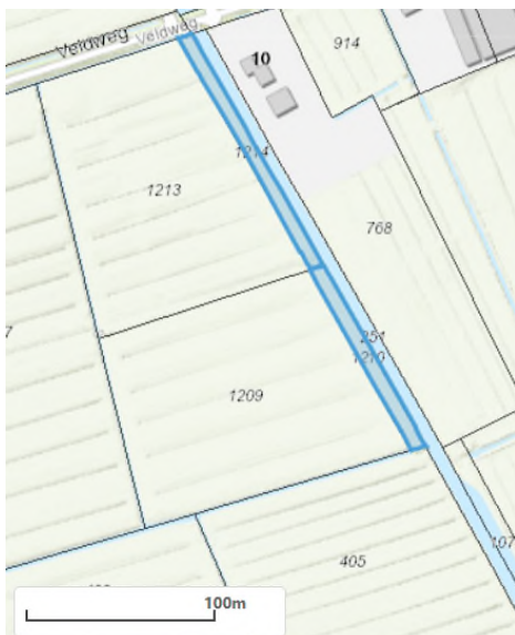
Figuur 3: locatie 026 en 029