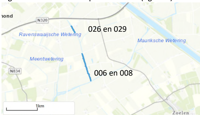
Figuur 2: overzichtskaart locaties

Het werk betreft het aanleggen van natuurvriendelijke oevers (NVO) op een aantal locaties in eigendom van waterschap Rivierenland (figuur 2).