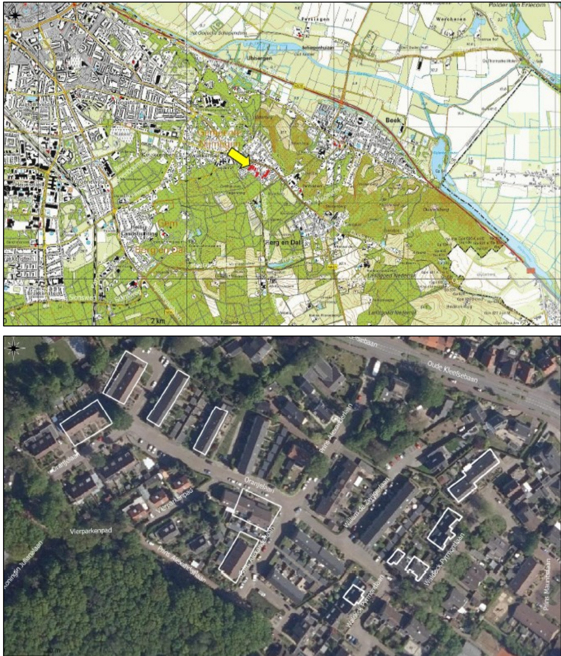
Figuur 1. De ligging en begrenzing van het plangebied aan de Oranjelaan 5 en omgeving te Berg en Dal. Op de onderste afbeelding zijn de 45 te renoveren woningen wit omlijnd.