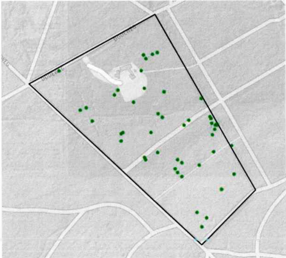
Figuur 4: de plaatsen waar hazelwormen zijn weggevangen (op sommige plaatsen 2 tegelijk)

Uit: "Wegvangen hazelwormen landgoed Soria Moria te Maarn" van 30 september 2021