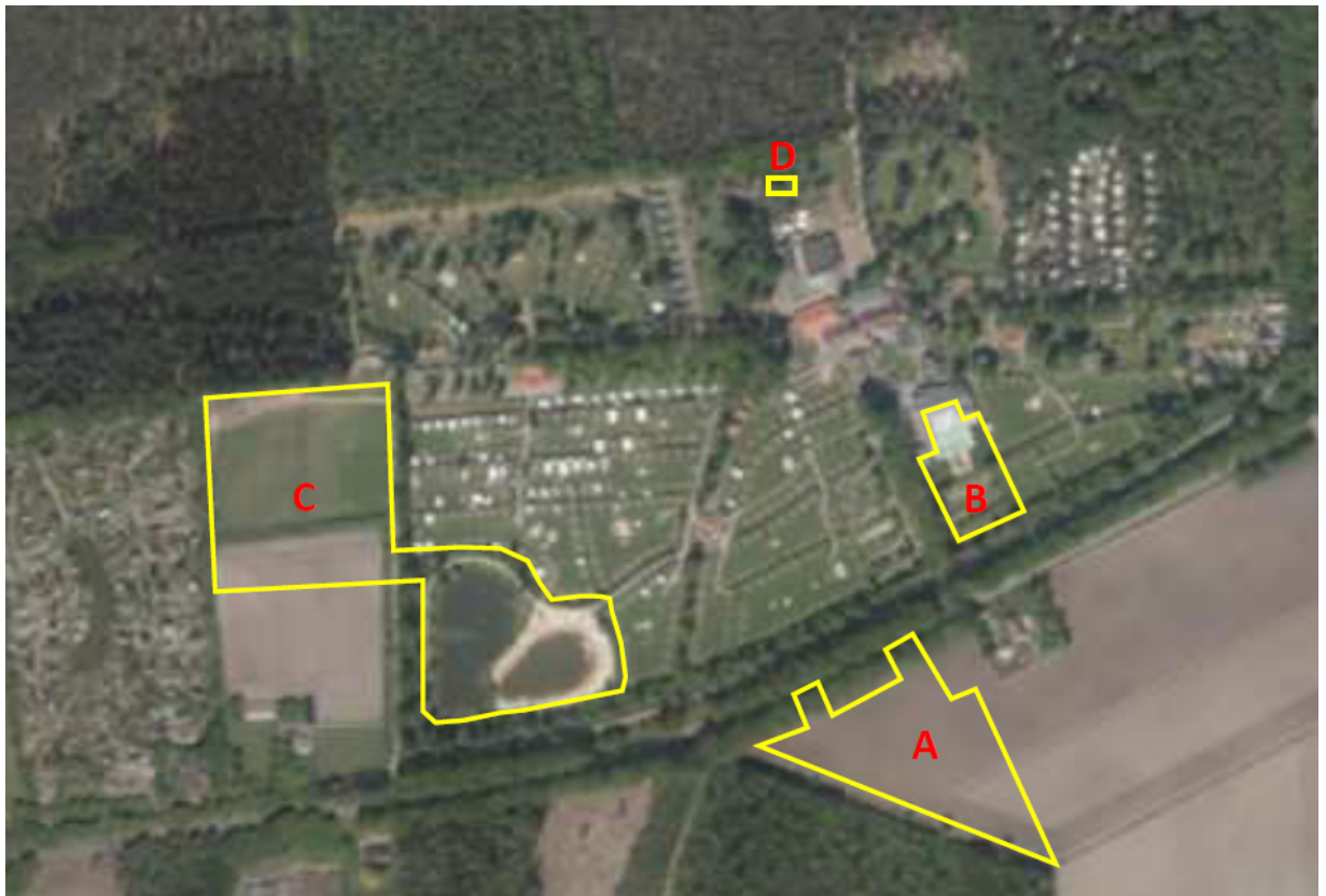
Figuur 2 Ligging projectgebied C, zwemvijver (rechtsonder) en geplande nieuwe visvijver (linksboven)

Locatie C bestaat uit agrarische cultuurgrond, een sportveld, een zwemvijver, beplanting en verharding. De agrarische cultuurgrond bestaat uit een soortenarme vegetatie dat intensief wordt beheerd. Het meeste noordelijke deel van het plangebied vormt een sportveld dat volledig bestaat uit kort gemaaid gras. De beplanting bestaat uit enkele loofbomen, struiken en rietvegetatie. Rondom de zwemvijver staan enkele jonge loofbomen, struiken en rietvegetatie. Tevens vormt de beplanting houtsingels welke een scheiding vormen tussen het akkerland en het sportveld en tussen de zwemvijver en het sportveld. Deze houtsingels bestaan volledig uit dichtbegroeide struiken. Door het plangebied lopen enkele onverharde wandelpaden. Het plangebied grenst aan houtsingels, onverharde weg en agrarische cultuurgrond.