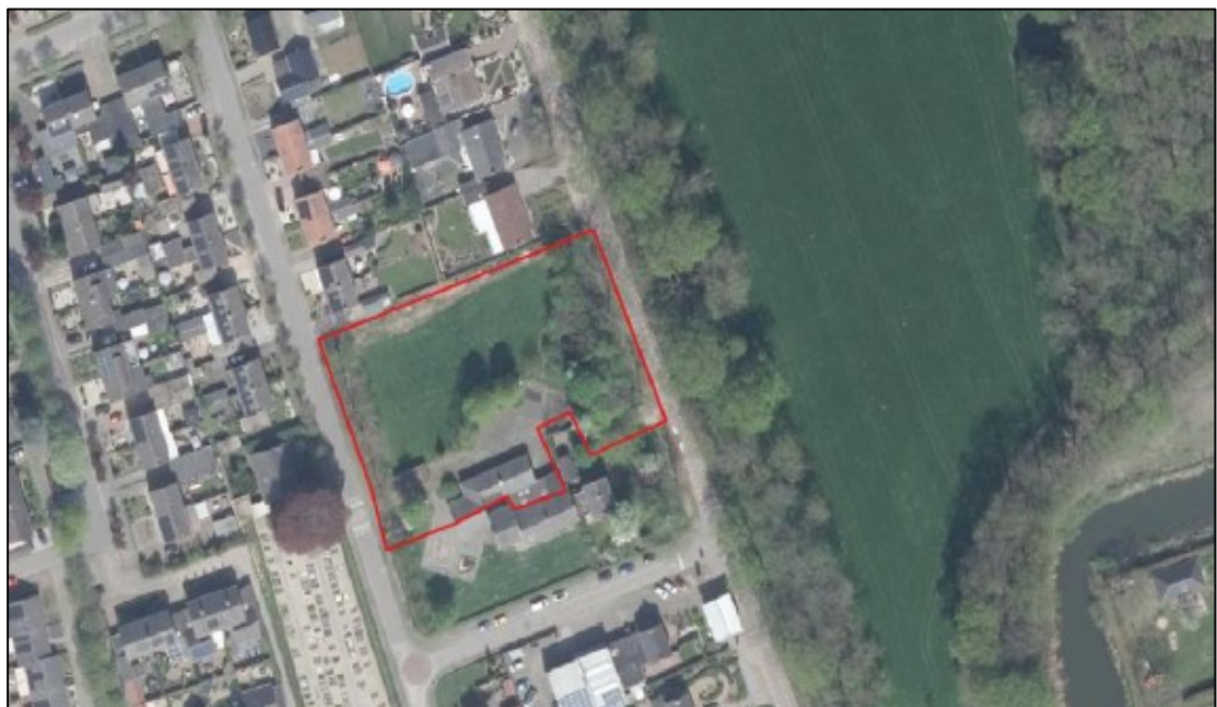
Figuur 1. De ligging en begrenzing van het plangebied aan de Spitsestraat 8 te Appelteren. Op de onderste afbeelding is het plangebied (circa 0,3 hectare) rood omlijnd.