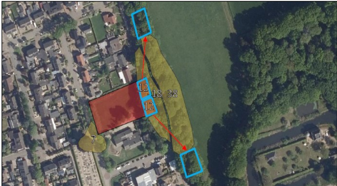
Figuur 2. De locaties van de verplaatsingen van de roekennesten. In totaal worden 24 roekennesten verplaatst, voorafgaand aan de kap van de circa 20 bomen binnen het plangebied. De helft, 12 nesten, wordt naar de bomenrij aan de noordzijde verplaatst, terwijl de andere helft naar de zuidzijde verplaatst wordt (blauwe vierkanten). Het rood gearceerde gebied weergeeft het plangebied, terwijl de geel gearceerde gebieden lokale roekenkolonies weergeven.