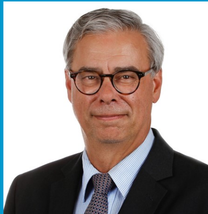
Burgemeester gemeente Waalre Voorzitter basisteam Kempen

De zorg voor veiligheid is een kerntaak van de gemeente. Die verantwoordelijkheid dragen we samen met vele partners. Veiligheid is veel omvattend en gaat om zaken waar inwoners dagelijks (bewust en onbewust) mee te maken krijgen. Denk daarbij aan veiligheid tijdens grote evenementen of de wetenschap dat de brandweer op tijd arriveert bij een brand, maar ook vervelende zaken zoals fietsendiefstal, woninginbraak, geweldpleging of de verwevenheid van de onderwereld met de bovenwereld. Veiligheid is een basisvoorwaarde voor een aantrekkelijke woon-, werk- en leef- gemeente en voor een goede economische en sociale ontwikkeling. De gemeente moet niet alleen veilig zijn, inwoners moeten zich ook veilig voelen.