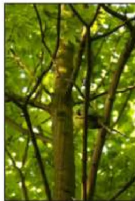
Figuur 10 en 11: Parende halsbandparkieten en nestlocatie