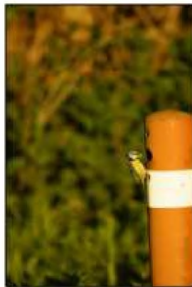
Figuur 9: Nestlocatie pimpelmees