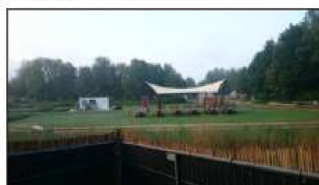
Figuur 13: Impressie festivalterrein