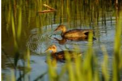
Figuur 5: Koppel kraakeend in het projectgebied