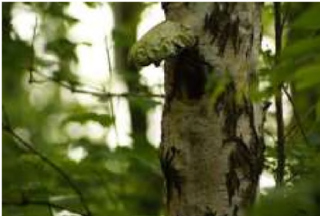
Figuur 7: Nestlocatie grote bonte specht