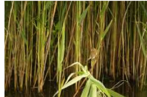
Figuur 8: Kleine karekiet in broedbiotoop