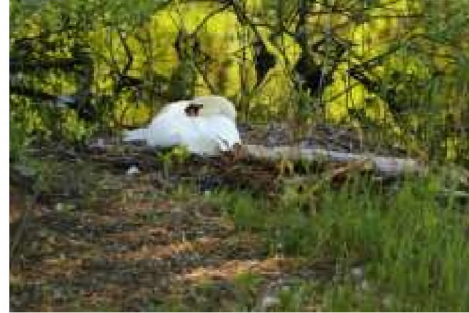
Figuur 6: Nestlocatie knobbelzwaan