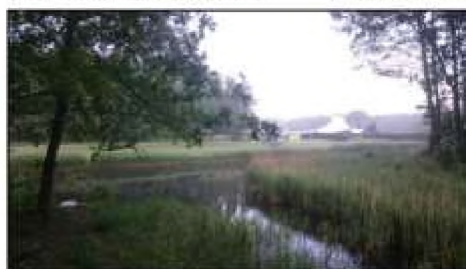
Figuur 12: Knobbelzwaan buiten festivalterrein