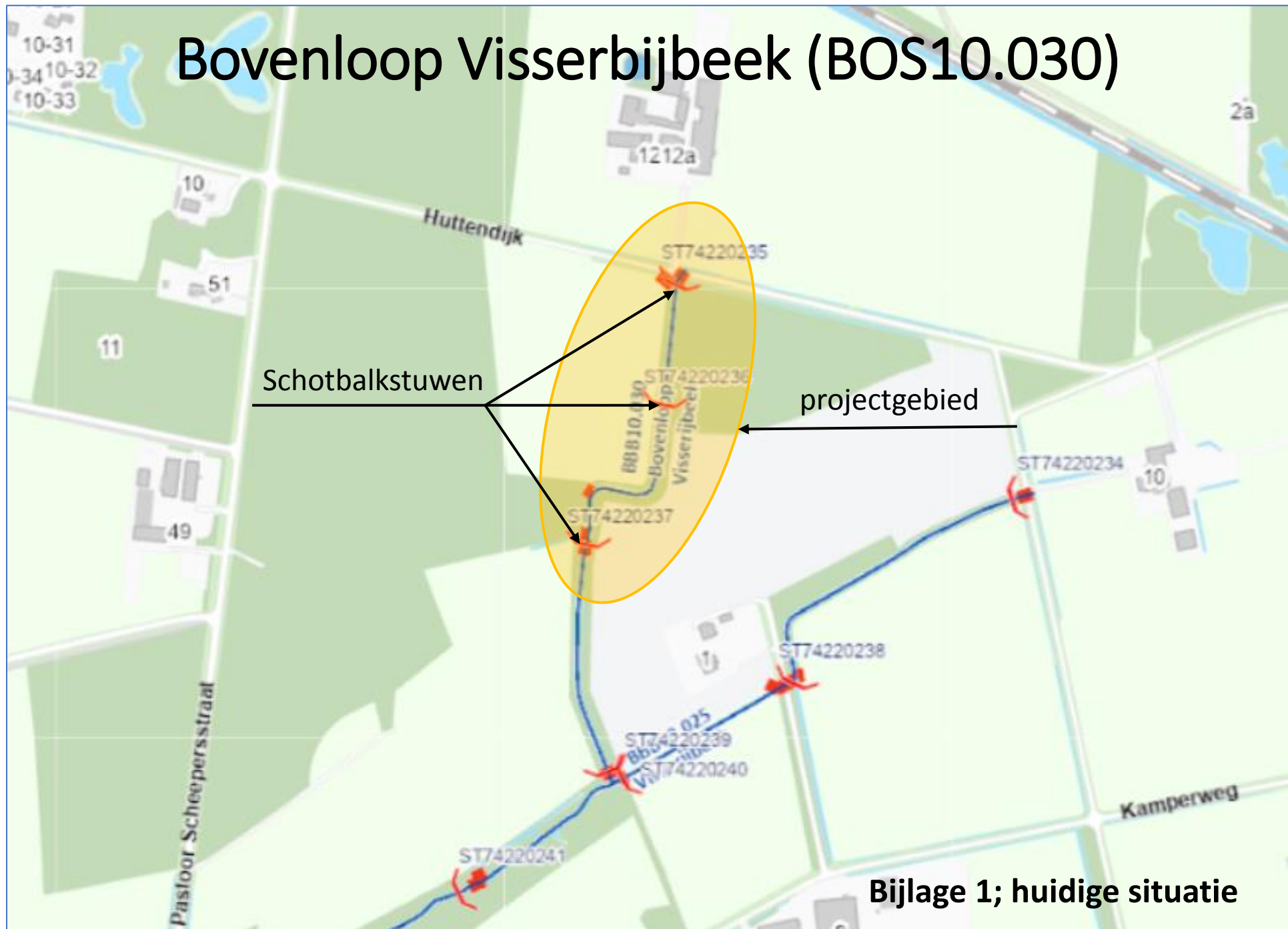
Bijlage 1; huidige situatie