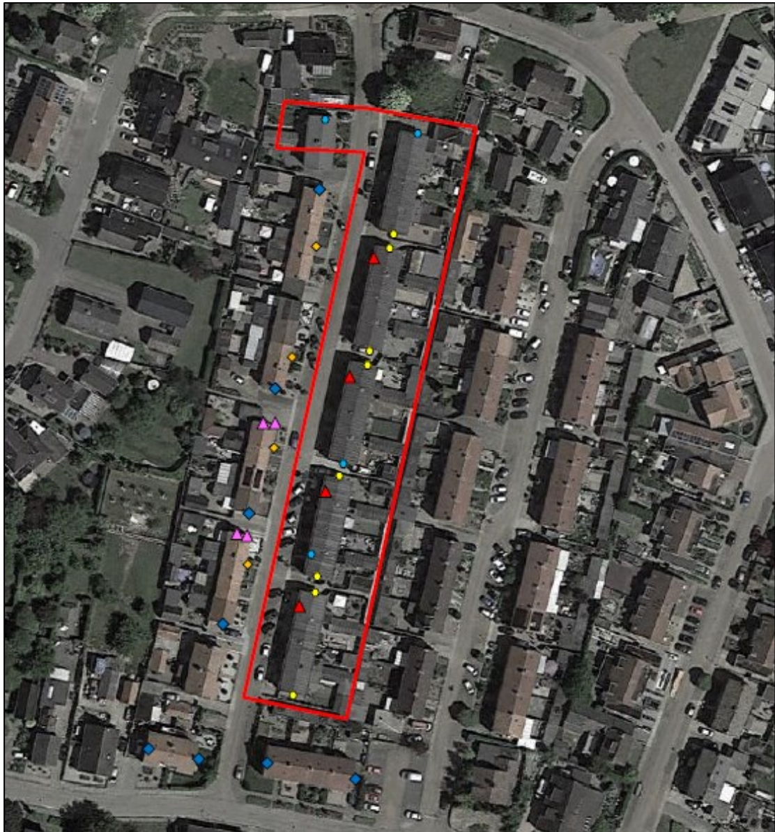
Figuur 2. De locaties van de tijdelijke en permanente voorzieningen voor huismuis en gewone dwergvleermuis. De oranje ruiten weergeven 4 tijdelijke vloermuiskasten van het type VK MP 06 van Vivara Pro, terwijl de blauwe ruiten 8 tijdelijke kraamkasten van het type VK SK 01 van Vivara Pro weergeven. De oranje driehoeken weergeven 4 tijdelijke huismuskasten van het type NK GZ 08 van Vivara Pro. De gele stippen weergeven 8 permanente inmetseelkraamkasten van het type VMPMK1 van Unitura, terwijl de blauwe stippen 4 permanent geschakelde IB VL 06/08 kasten weergeven. Tot slot weergeven de rode driehoeken 4 permanente huismuis inbouwkasten van het type NK MU 06 van Vivara Pro. Voor alle kasten geldt dat het ook soortgelijke kasten mogen zijn.