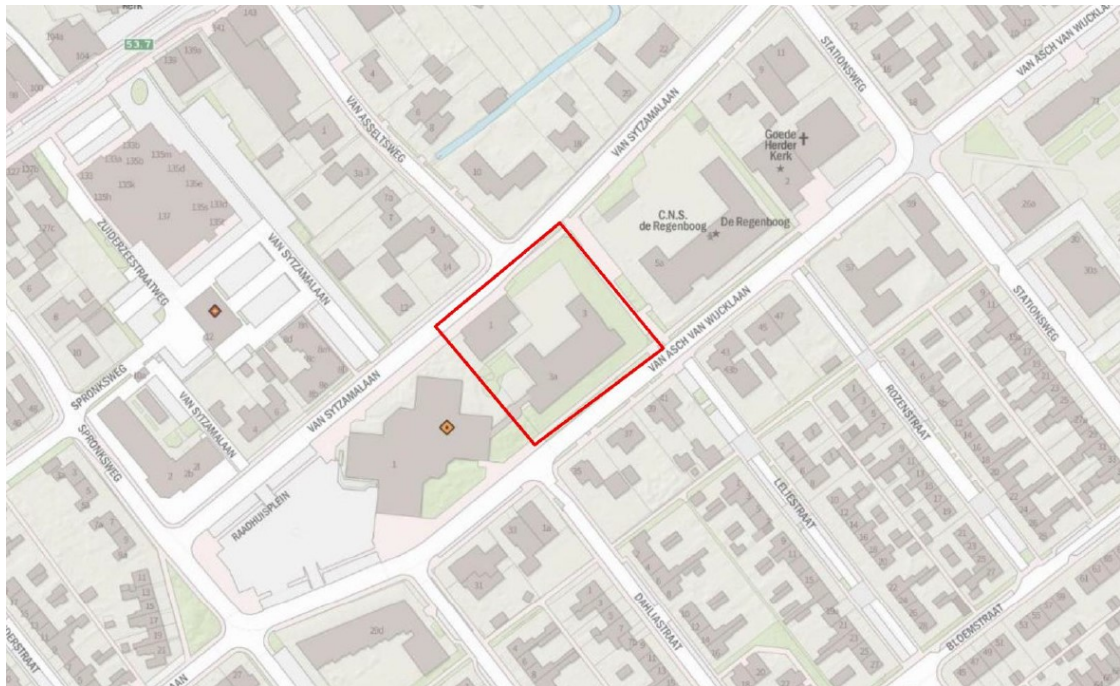
Figuur 1: Ligging plangebied binnen rode kader (Mulder, 2021)