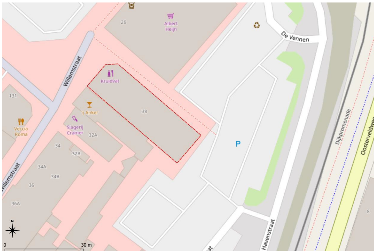
Figuur 1. Plangebied waarvoor deze ontheffing geldt.

Werkzaamheden: Onder de werkzaamheden vallen energetische maatregelen zoals het isoleren van daken vanaf de buitenzijde, het isoleren van muren door het vullen van de spouw en het aanbrengen van dubbelglas. Mogelijk worden zonnepanelen geplaatst.