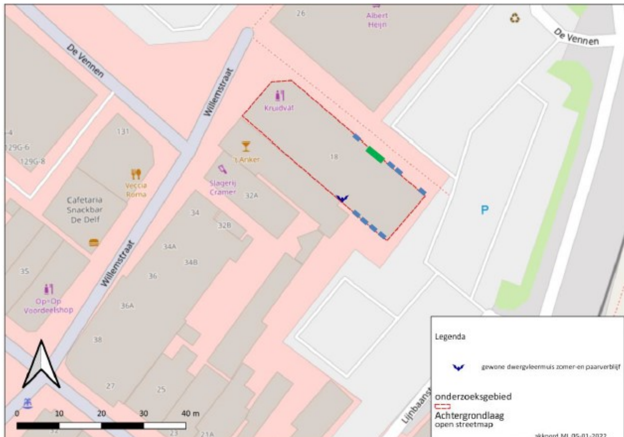
Figuur 2. Locatie permanente vleermuiskasten (blauwe lijnen) en het trappenhuis met open stootvoegen (groene lijn).

Conform het kennisdocument (Kennisdocument Gewone dwergvleermuis, 2017) moet een verblijfplaats met een factor vier worden gemitigeerd. Dat betekent dat, met het vaststellen van één verblijfplaats er (1 x 4 =) vier nieuwe verblijfplaatsen terug moeten komen. Daarnaast worden ten behoeve van de ecologische groene plus geleden in de provincie Groningen eveneens vier kasten bijgeplaatst waarmee het totaal op acht kasten uitkomt. De kasten worden zo hoog mogelijk geplaatst. Hierbij blijft er een vrije in- en uitvliegroute onder de kast aanwezig en de in- en uitvliegopeningen worden niet beschreven door lichtbronnen (zoals lantaarnpalen, buitenlampen en dergelijke). De kasten worden over de gevels verdeeld. In figuur 2 zijn de locaties van de inbouwkasten weergegeven.