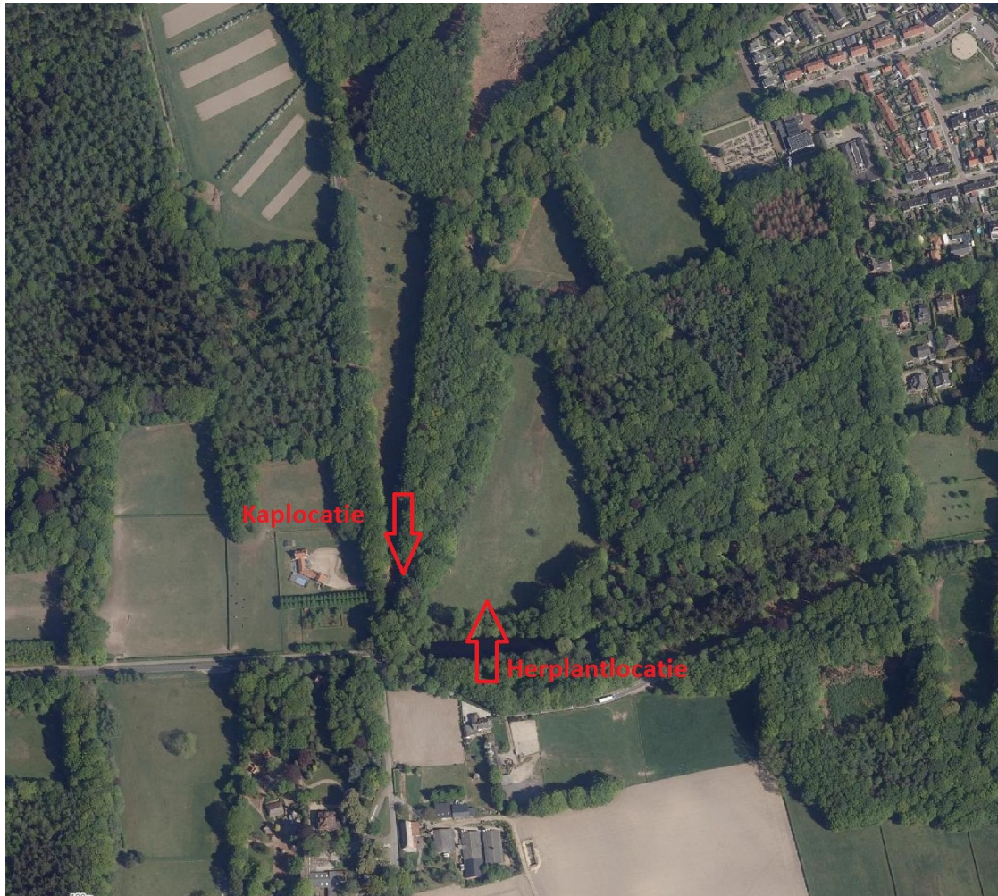
Figuur 4: Kaplocatie en herplantlocatie liggen beide aan een boskern van 5 hectare of meer.