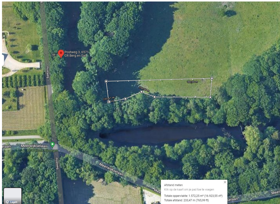
Figuur 2: Herplantlocatie, Postweg 3 gemeente Berg en Dal, kadastraal perceel Groesbeek, sectie H, nummer 2611. Oppervlakte is 15,7 are.