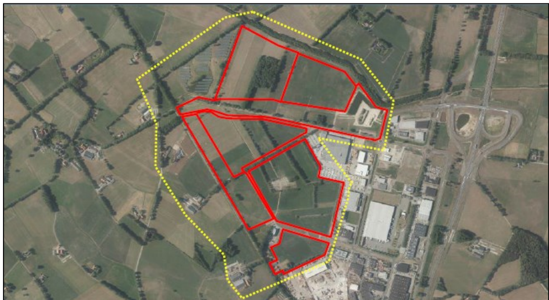
Figuur 1. Ligging en begrenzing van het plangebied aan Ruiterspad 4 en omgeving ('Bedrijventerrein Laarberg' te Groenlo). Op de onderste afbeelding is het totale plangebied rood omlijnd, terwijl het onderzoeksgebied geel omlijnd is.