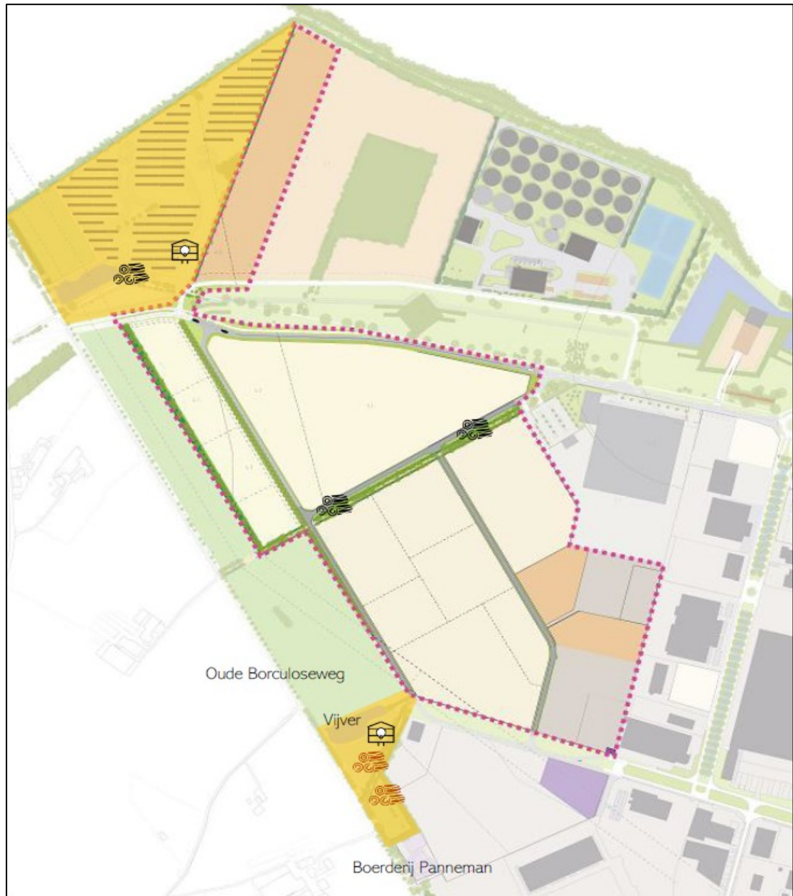
Figuur 4. De locaties van de permanente alternatieve voorzieningen voor bunzing, wezel en hermelijn. De boomstammen weergeven de locaties van 5 takkenrillen. De huisjes weergeven de locaties van 2 marterhopen. De takkenrillen in het zuiden (rood gemarkeerd) zijn reeds geplaatst op 14 december 2021. De zwart weergegeven 3 takkenrillen én de 2 marterhopen zijn in week 6 (7 tot 11 februari) van 2022 aangebracht.