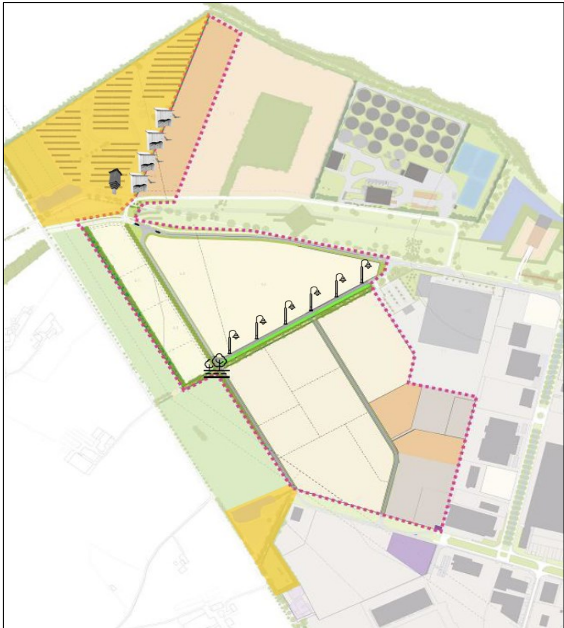
Figuur 3. De locaties van de permanente alternatieve voorzieningen voor gewone dwergyleermuis en gewone grootoorvleermuis. De 4 bolle vleermuiskasten van het type VK WS van Vivara Pro (of soortgelijk) zijn met witte iconen weergegeven, ten noorden van het plangebied. De vleermuispaal van het type VK SK 05 daarnaast. Aan de nieuwe ontsluitingsweg, ten noorden en noordoosten van de Holtkampsweg – tussen deelgebied Noord en Centraal – zijn de vleermuisvriendelijke lantaarnpalen weergegeven. Ten westen daarvan – bij de doorsnijding van de Holtkampsweg voor de aanleg van een nieuwe ontsluitingsweg – is de locatie van de hop-over weergegeven.