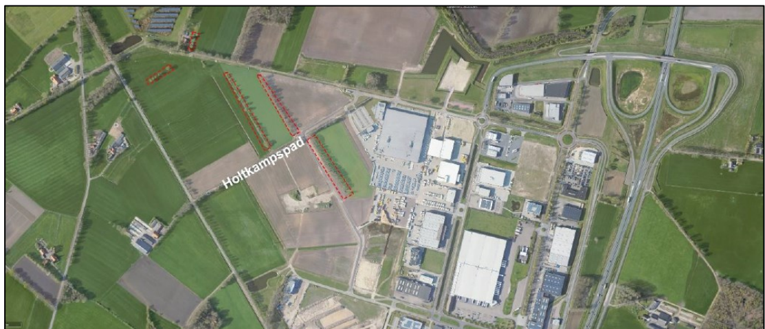
Figuur 2. De verschillende deelgebieden binnen bedrijvenpark Laarberg te Groenlo (afbeelding boven). De werkzaamheden binnen deze ontheffing vinden plaats in drie deelgebieden, te weten: Biobased Transitiepark 2, Noord en Centraal. Op de onderste afbeelding zijn de te kappen bomen rood omlijnd weergegeven. Dit betreft bomen in alle drie bovengenoemde deelgebieden.