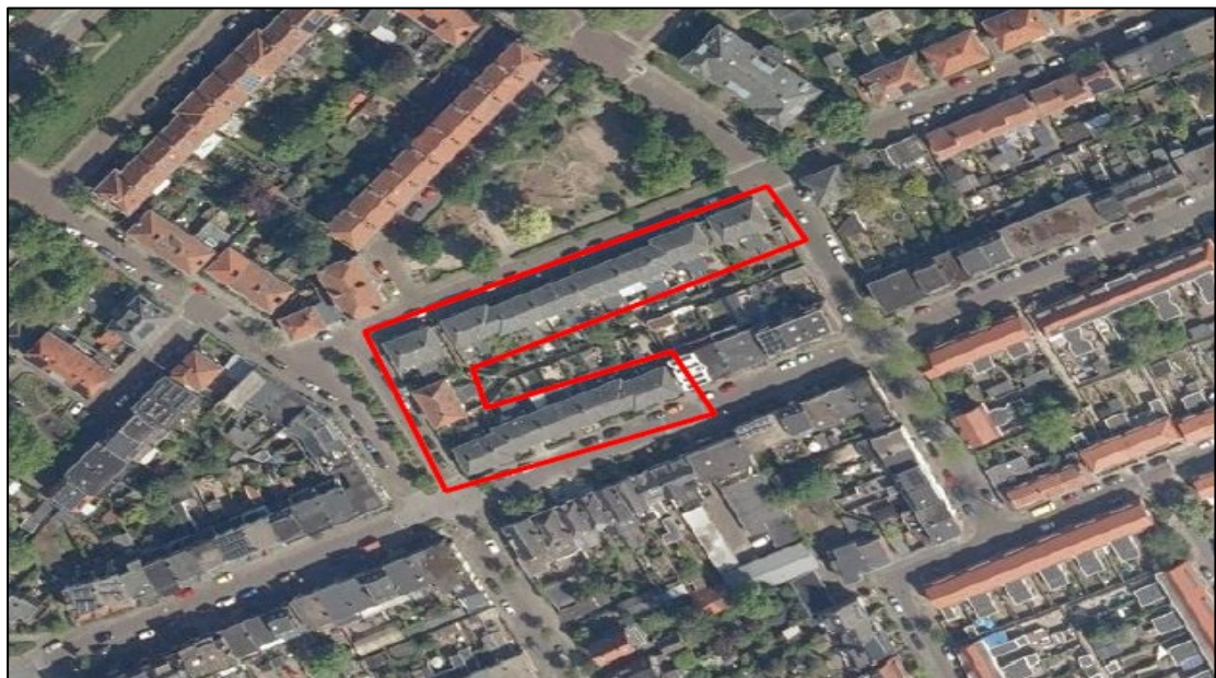
Figuur 1. Ligging en begrenzing van het plangebied aan de Praebsterkamp, Hemonystraat en Weg naar Laren te Zutphen. Op de onderste afbeelding zijn de 28 te renoveren woningen rood omlijnd.