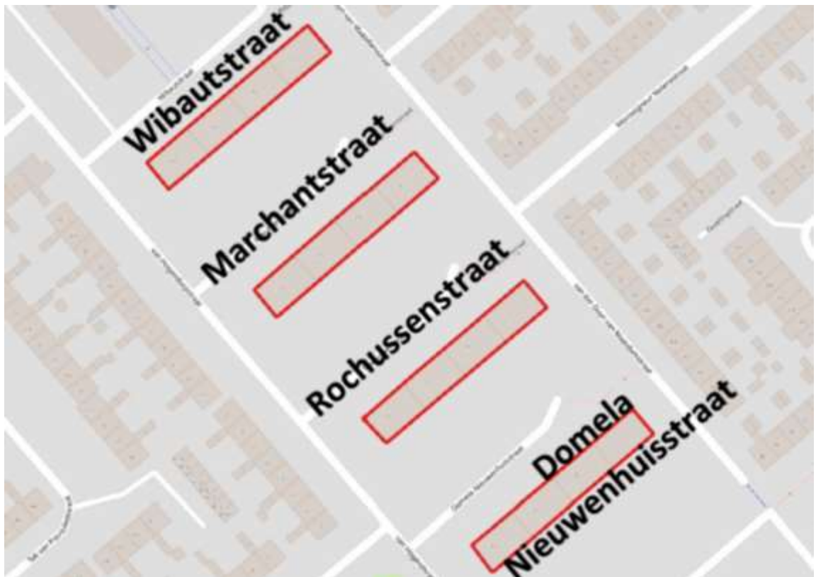
Figuur 1: Plangebied binnen rode kader (Klein Brinke, 2020)