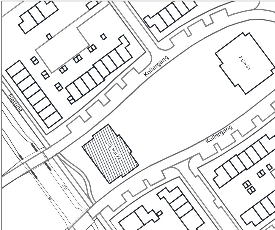
Kollergang begane grond