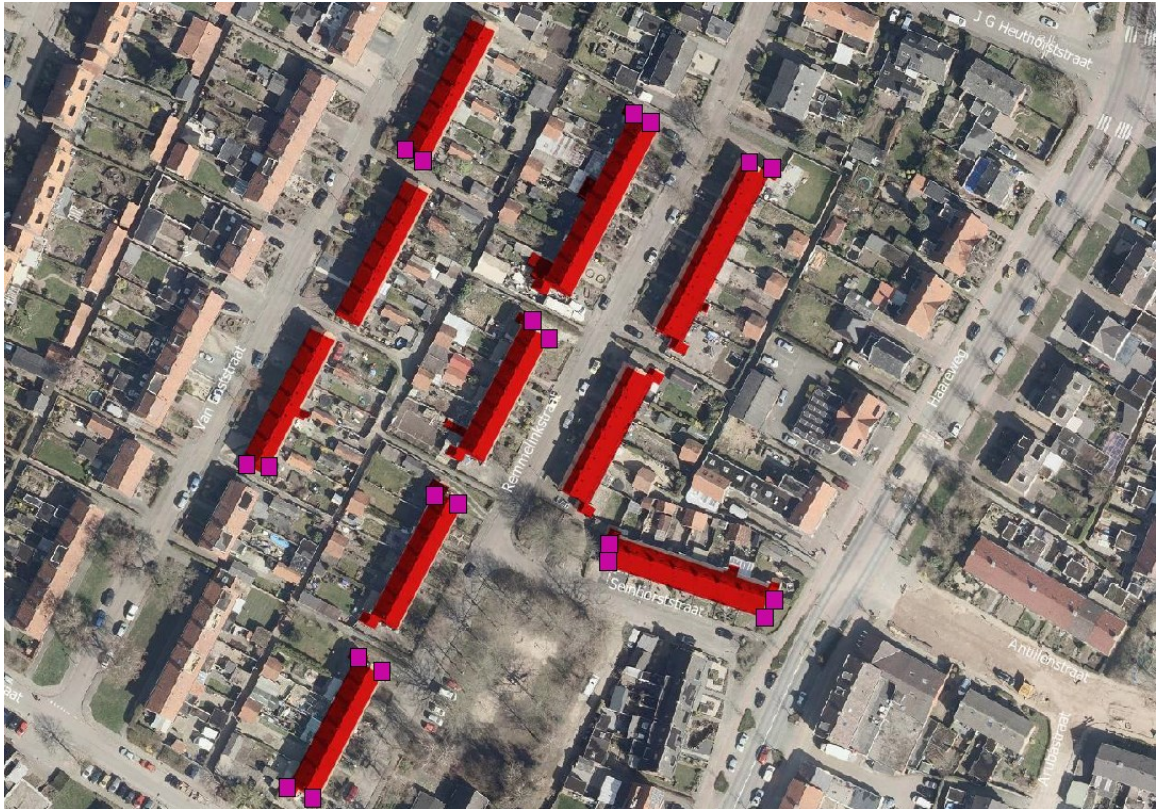
Figuur 3: locaties inmetselfallen gewone dwergvleermuis aangegeven in paars (Slemmer, 2020)