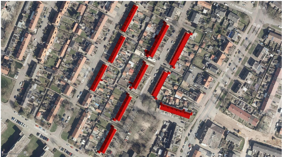
Figuur 1: Plangebied met rood aangegeven (Slemmer, 2020)