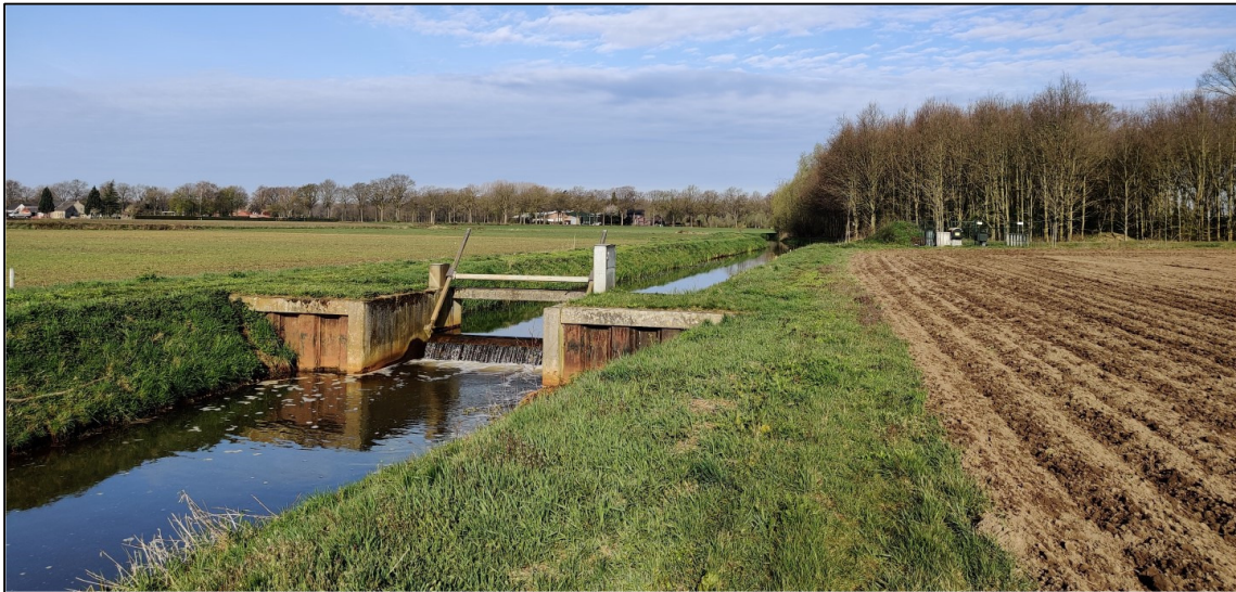
Beeld van de stuw. Het gemaal is op de achtergrond zichtbaar.