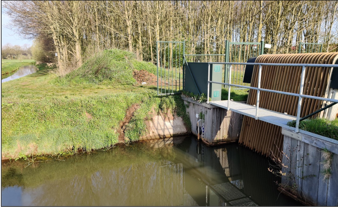
Beeld van het gemaal.