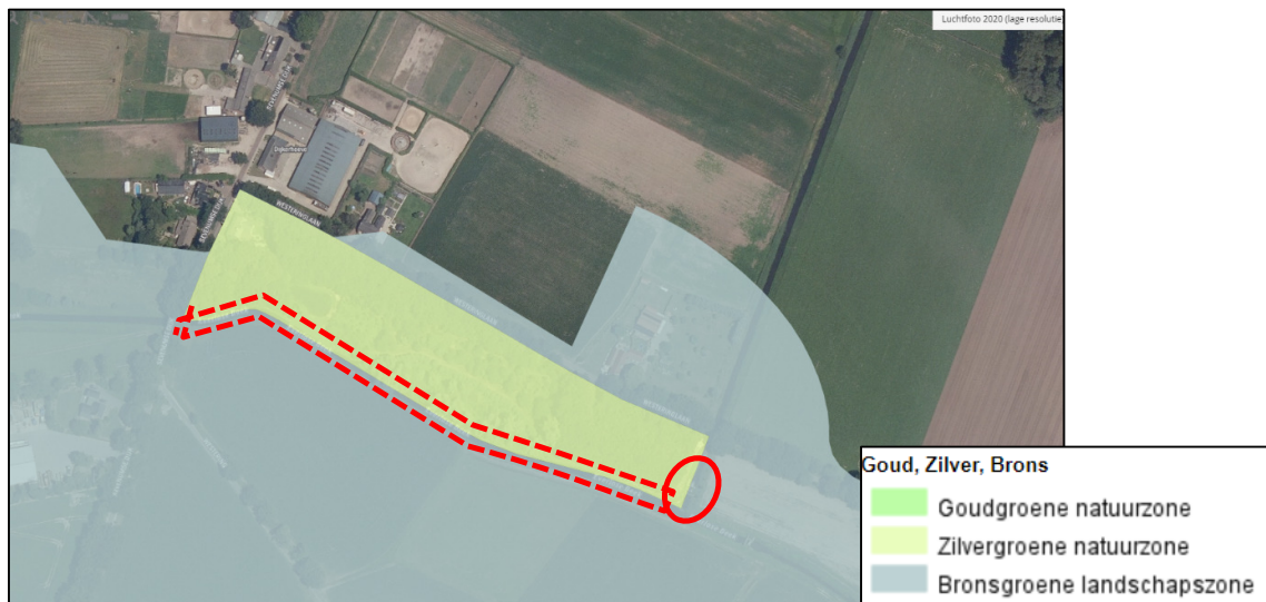
Ligging plangebied (rood) ten opzichte van de Bronsgroene landschapszone en Goudgroene natuurzone.