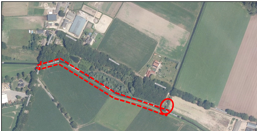
Ligging plangebied (rondje: gemaal, stippellijn: herprofilering Everlose beek).

Bijlage 2: Locatie (rood aangegeven) en foto's plangebied.