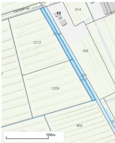
Figuur 3: locatie 026 en 029