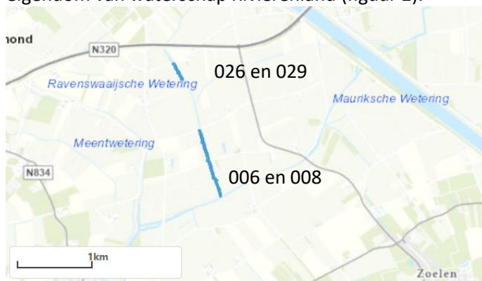
Figuur 2: overzichtskaart locaties

Het werk betreft het aanleggen van natuurvriendelijke oevers (NVO) op een aantal locaties in eigendom van waterschap Rivierenland (figuur 2).