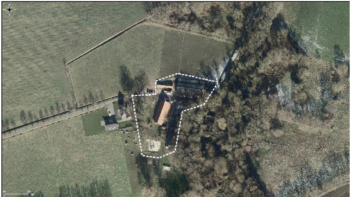
Figure 1: Overzicht plangebied