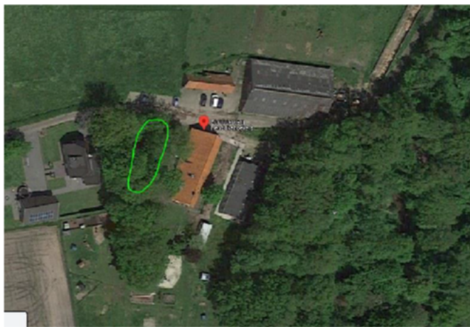
Figure 2: Locatie tijdelijke vleermuiskasten (groen omcirkeld)