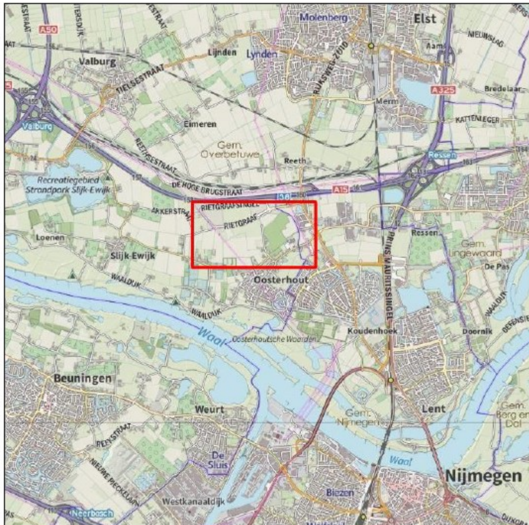
Figuur 1: Ligging van het projectgebied (binnen het rode kader)