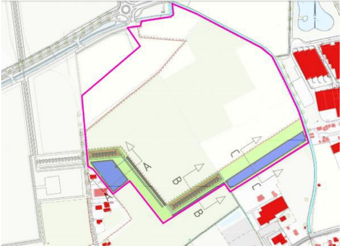
Figuur 2: Mitigatie voor de wezel

Beoogde toekomstige situatie met de grenzen van het projectgebied (paars kader) en het grasland (groen) met grondwallen en houtsingels (bruin).