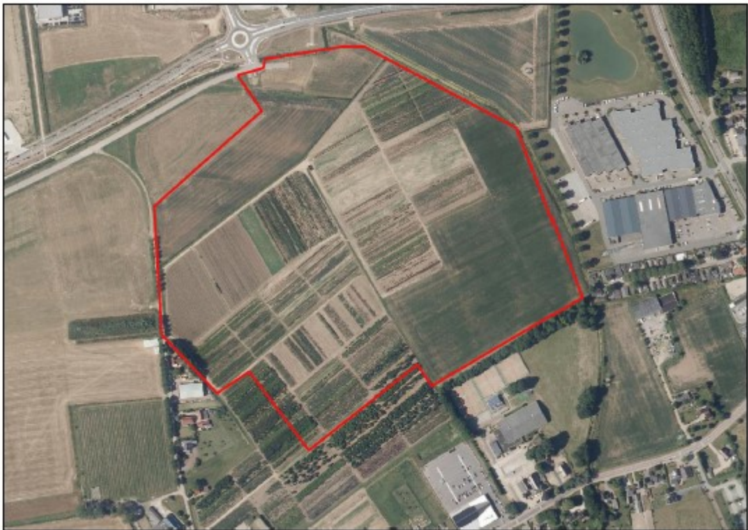
Figuur 2: Luchtfoto van het projectgebied (binnen het rode kader)