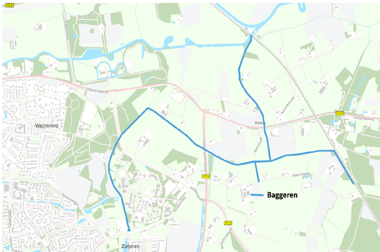
Afbeelding 2: Te baggen watergangen

Het baggeren van de watergang is een onderhoudsmaatregel en leidt niet tot wijziging van het waterstaatswerk. Dit is daarom geen onderdeel van het projectplan. De te baggeren watergangen zijn in onderstaand kaartje (afbeelding 2) opgenomen.