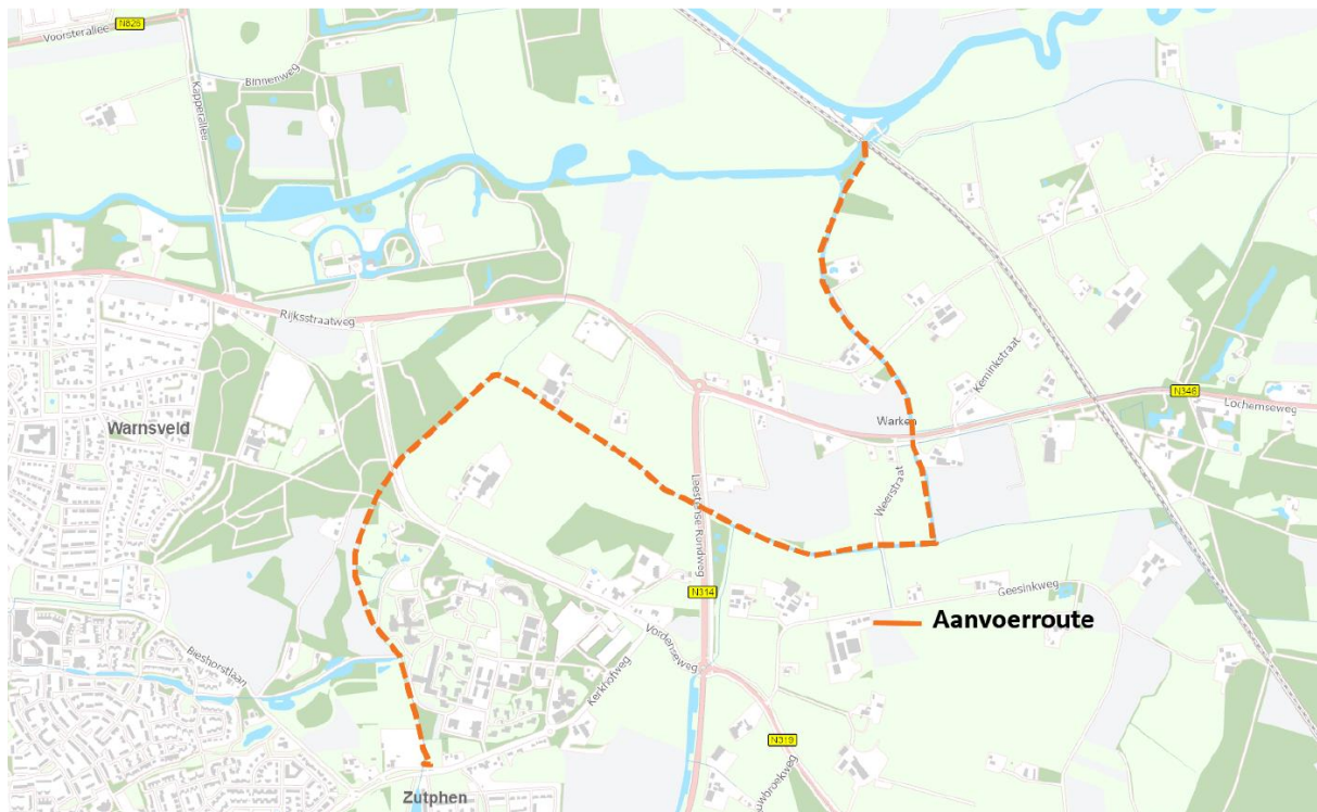
Afbeelding 1: Traject aanvoerroute

De maatregelen die zijn beschreven in dit Projectplan Waterwet beogen het op orde brengen van het aanvoersysteem van water (zowel kwantitatief als kwalitatief) met beter inzicht in de waterverdeling en mogelijkheden om de waterverdeling actief te sturen. Daarbij hoort ook het daar waar mogelijk verbeteren van ecologische kwaliteit en biodiversiteit en mogelijk maken van daarop toegespitst beheer en onderhoud.