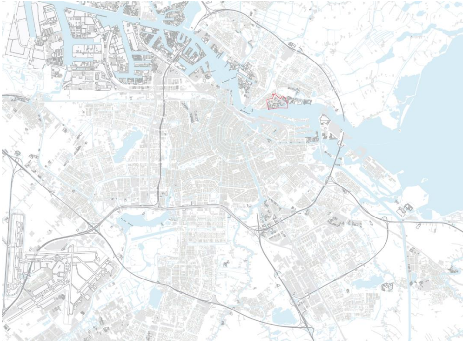
Figuur 2: Locatie Hamerkwartier

Dit Warmteplan beslaat het projectgebied Hamerkwartier.