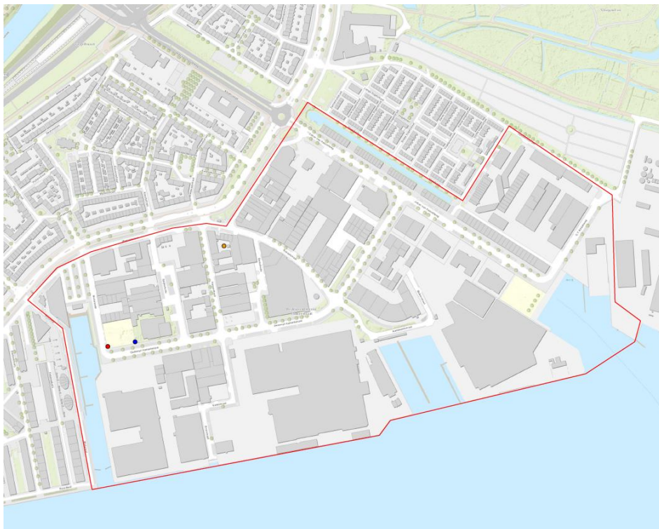
Figuur 3: Reikwijdte Warmteplan; Alle ontwikkelingen binnen de rode lijn vallen binnen dit Warmteplan.