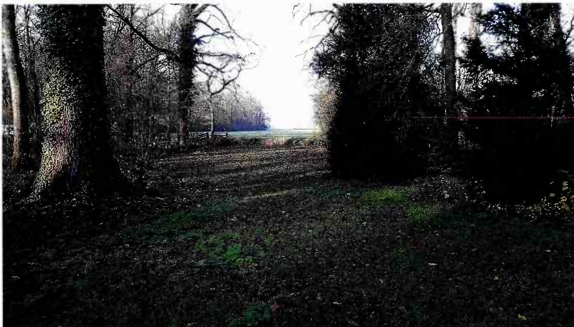
Afbeelding 1: Foto van de zichtlijn vanaf Huis te Linschoten.

De planlocatie ligt in het verlengde van een zichtlijn vanaf het Huis te Linschoten. Echter wordt de zichtlijn reeds beperkt door bomen en ligt de planlocatie op grote afstand van de zichtlijn. Het depot zal lager liggen dan de Haardijk en zal daarmee niet zichtbaar zijn vanaf het Huis te Linschoten. Zie ook afbeelding 1. Daarnaast wordt het baggerdepot op den duur ook gebruikt ten behoeve van het baggeren van de sloten op het landgoed Linschoten. Hierdoor is een baggerdepot in de buurt van het landgoed logischerwijs in te passen in de beleving van het landschap.