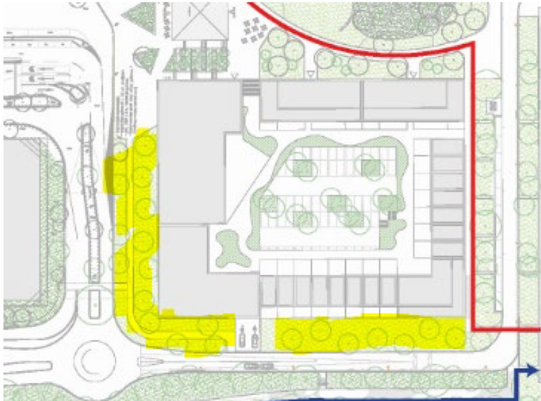
Figuur 2. De openbare ruimte (geel gearceerd) in het plangebied wordt na realisatie van de nieuwbouw ingezaaid met een inheems zaadmengsel, inclusief teunisbloem en kartuizer anjer.