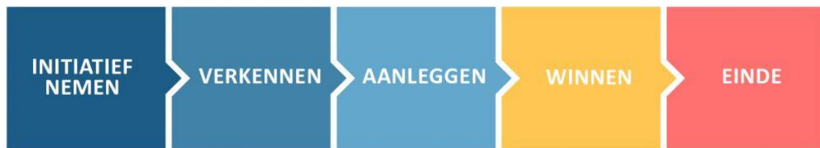
Figuur 3. Fasering geothermieproject

Binnen een aardwarmteproject zijn vijf fasen te onderscheiden (zie figuur 3) 6,7 : initiatief nemen, verkennen, aanleggen, winnen en einde. Hieronder lichten we ze toe.