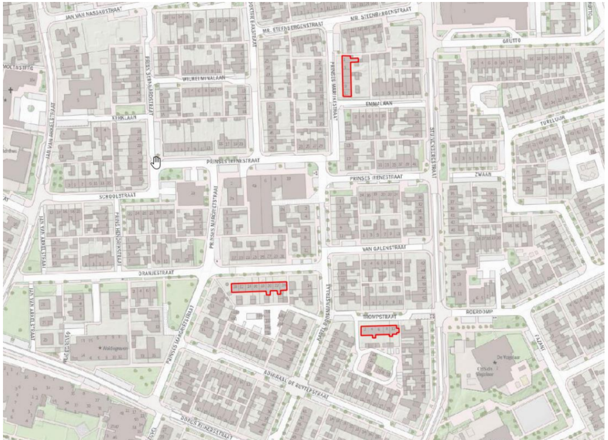
Figuur 1; De te verduurzamen woningen (rood omljnd)

Buitenpandige werkzaamheden bij de woningen aan de Oranjestraat bestaan uit naisolatie van de spouwmuur bij kopgevels en lengtegevels, het plaatsen van nieuwe kozijnen, het plaatsen van zonnepanelen, diverse schilderwerkzaamheden, het plaatsen van een aanbouw achter de woningen en plaatsen van steigers voor uitvoering van deze werkzaamheden.