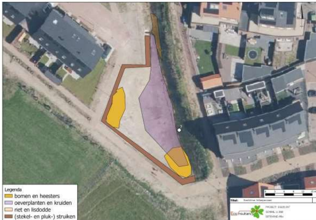
Figuur 3: Globale inrichting uitzetlocatie poelkikker