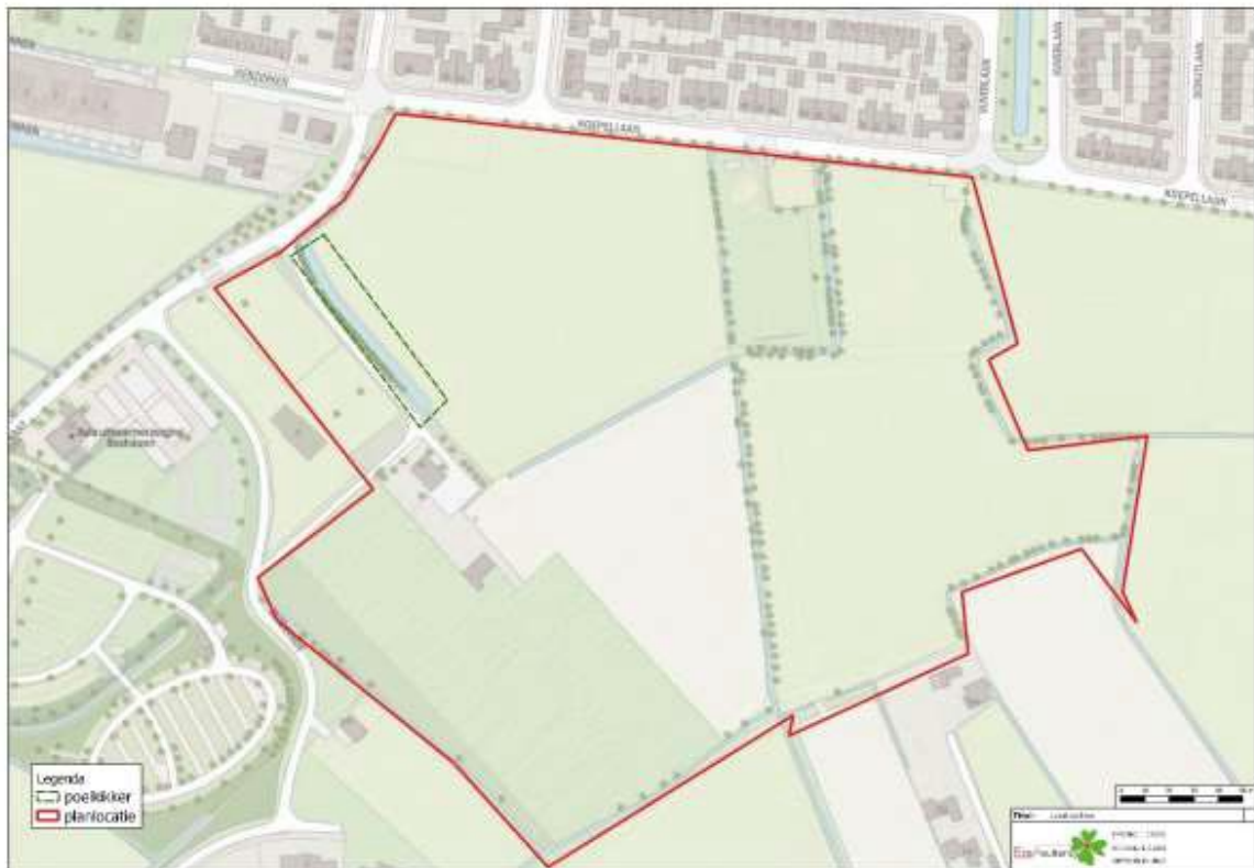
Figuur 1: Huidig leefgebied poelkikker (groene kader)