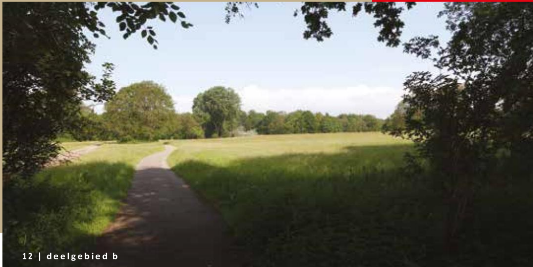
12 | deelgebied b