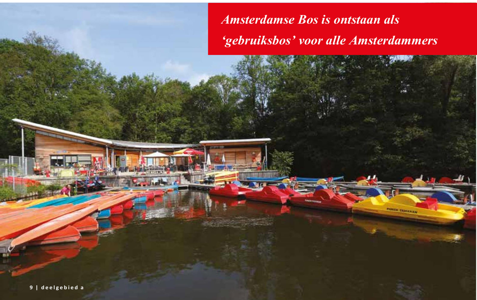
9 | deelgebied a

Amsterdamse Bos is ontstaan als 'gebruiksbos' voor alle Amsterdammers