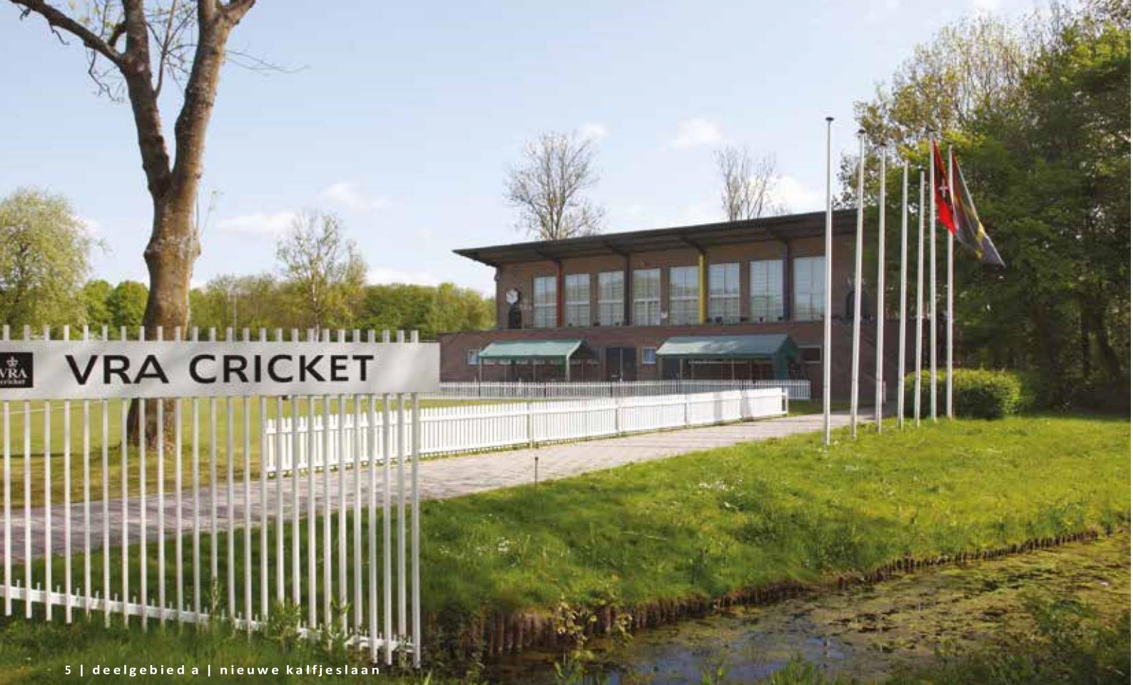
5 | deelgebied a | nieuwe kalfjeslaan