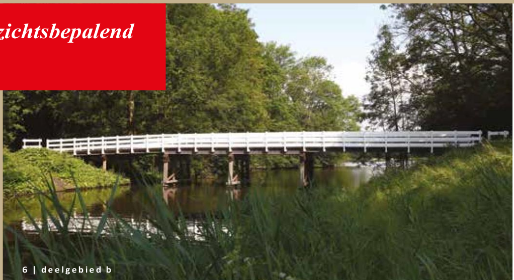
6 | deelgebied b

8 Aan de Nieuwe Meerlaan staat een beheergebouw van de gemeente. Hier zijn dezelfde materialen gebruikt als op andere plekken in het Amsterdamse Bos: hout en staal. Afhankelijk van de plek waar de bebouwing staat zijn deze materialen in een andere verhouding gebruikt.