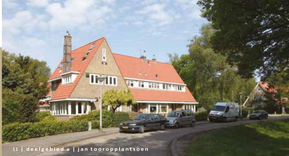
11 | deelgebied a | jan tooropplantsoen

11 De woningen aan het Jan Tooropplantsoen stammen uit de jaren dertig en zijn rijk gedetailleerd, zoals te zien is aan de dakoverstekken, specifieke hoekwoningen, markante schoorsteen en verschillende dakramen.