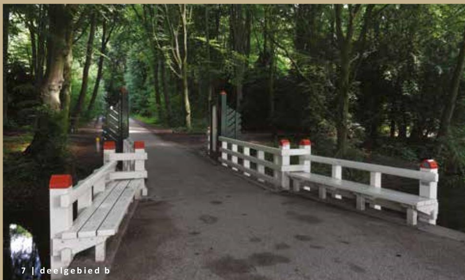
7 | deelgebied b