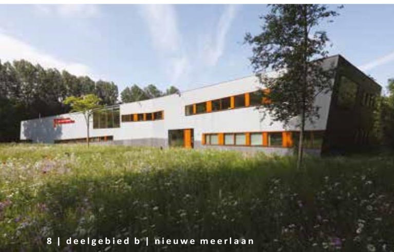
8 | deelgebied b | nieuwe meerlaan

De belangrijkste gebouwen liggen bij de sportvelden en de Bosbaan, maar hebben afgezien van de accommodaties op de kop van de Bosbaan, geen opvallende vormgeving en uitstraling. In het verlengde van de Kalfjeslaan (Nieuwe Kalfjeslaan) is als tweede entree een klein en besloten woonbuurtje ontstaan van enkele woonblokken met karakteristieke woningen met dubbele kap, bakstenen gevels en dakpannen daken.