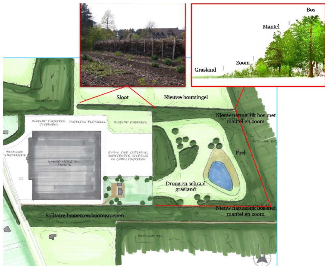
Figuur 3 Inrichting natuurgebied met onder andere een poel, een nieuwe houtsingel, droog en schraal grasland, bomen en bos.