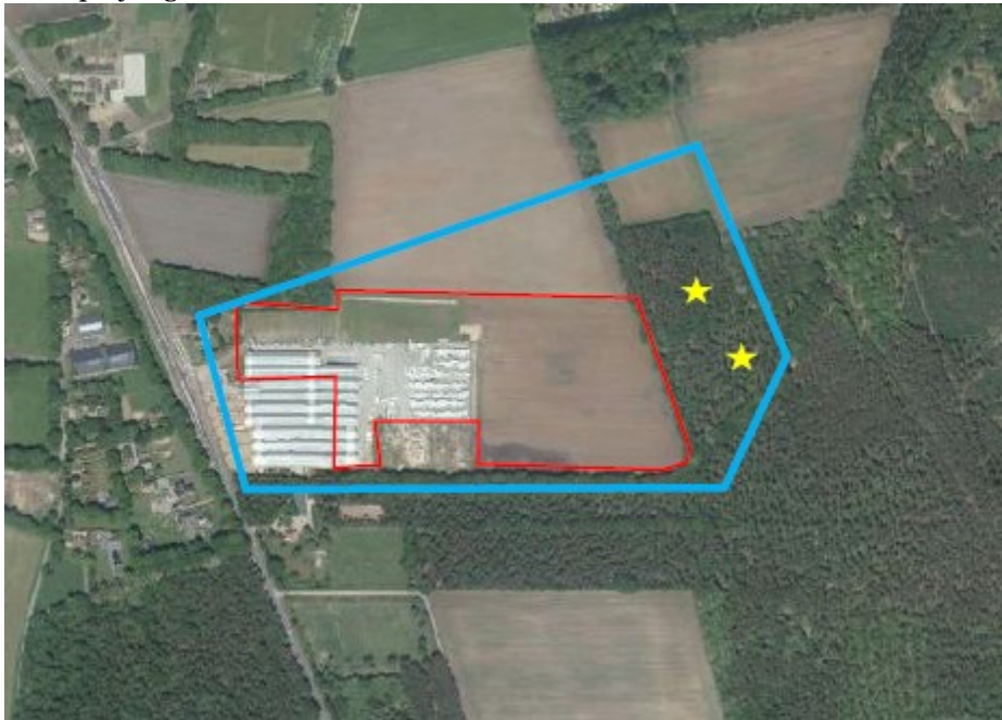
Figuur 1 Begrenzing plangebied (rood omlijnd) met locaties van de dassen(bij)burchten (sterren).