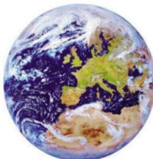
Figuur 1: De te beschermen omgeving

In hoofdstuk 6 staan de overlegstructuur en de informatie-uitwisseling beschreven en de rol van de provincie daarin. Daarnaast worden in dit hoofdstuk de situaties beschreven waarin meerdere bevoegde