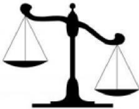
Figuur 4: Gedogen, een afweging van belangen

Voor het gedeelte dat gedoogd wordt, dient er sprake te zijn van een bijzondere omstandigheid zoals bij de 'reguliere' gedoogbeschikking. Met andere woorden het toetsingskader van het gedoog gedeelte van de partiële handhavingbeschikking is identiek aan dat van de gedoogbeschikking; namelijk passend binnen het gedoogkader. De regel blijft dus dat een handhavingsbesluit gericht moet zijn op het volledig beëindigen of ongedaan maken van (de gevolgen van) een overtreding, tenzij er sprake is van 'bijzondere omstandigheden'.