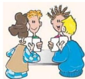
Figuur 5: Beter resultaat door samenwerken

In onderstaande tabel 5 zijn ook de overige overleggrema genoemd, met daarbij de belangrijkste kenmerken per overleg. Alle genoemde overleggen worden 'Wabo-breed' georganiseerd.