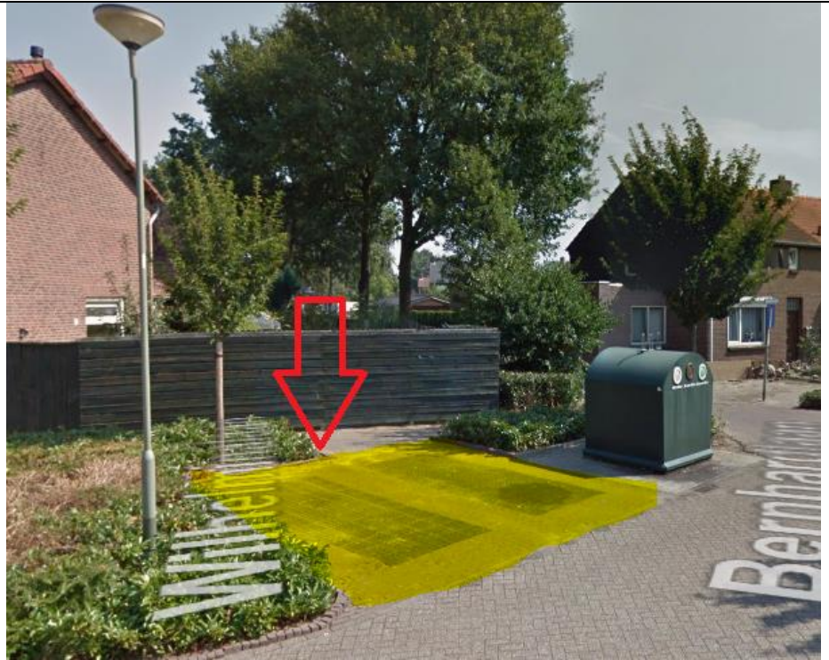
Foto 2 locatievoorstel