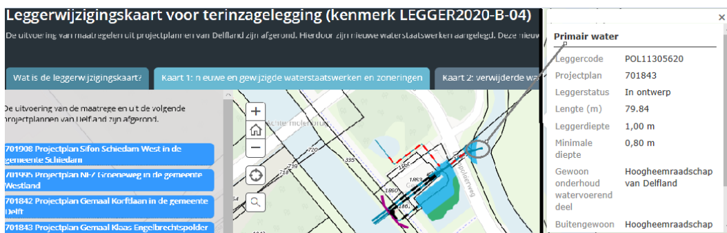
Figuur 1: Voorbeeld weergave van de interactieve leggerwijzigingskaart

op wie de onderhoudsplicht rust. Ook kan, indien van toepassing, de bijlage met het leggerprofiel worden geopend. Een voorbeeld van de werking van de leggerwijzigingskaart is weergegeven in Figuur 1.