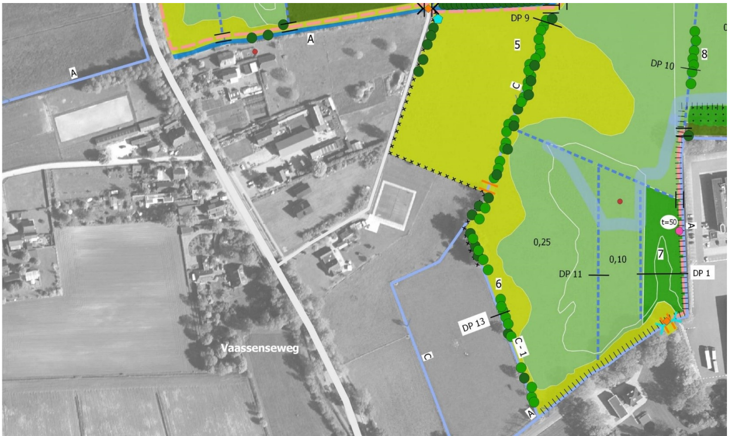
Figuur 3: Inrichtingsmaatregelen zuidwestzijde plangebied