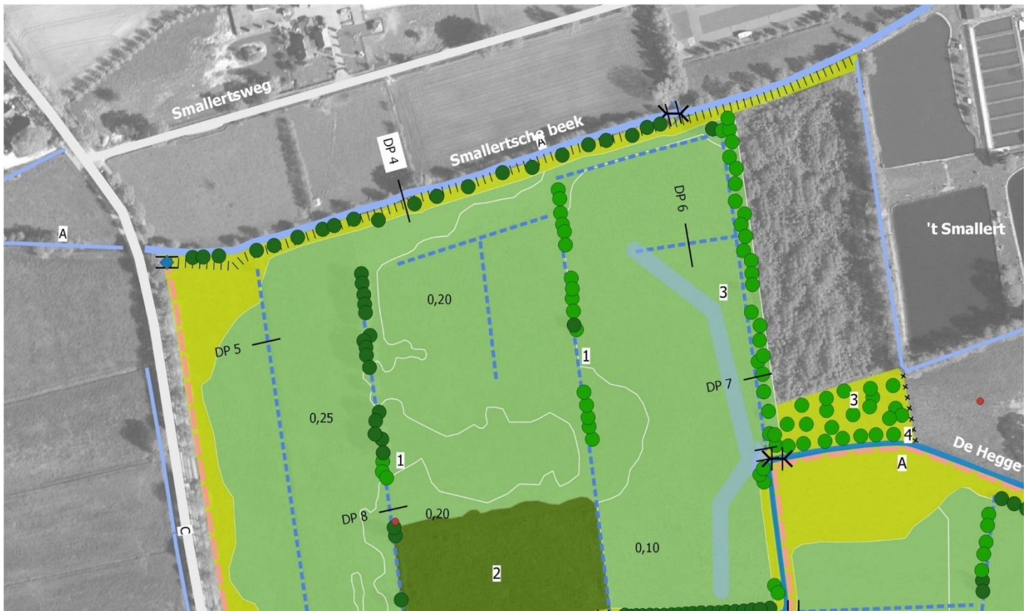
Figuur 1: Inrichtingsmaatregelen noordwestzijde plangebied

Onderstaande figuren weergeven alle inrichtingsmaatregelen die in het plangebied worden uitgevoerd. De halve blauwe bollen op figuur 2 en 4 geven (indicatief) weer waar in de Hegge de prikkenpoelen worden gerealiseerd. De donkergroene bollen op figuur 1-4 geven de bestaande beplanting weer en de lichtgroene bollen de nieuwe beplanting.