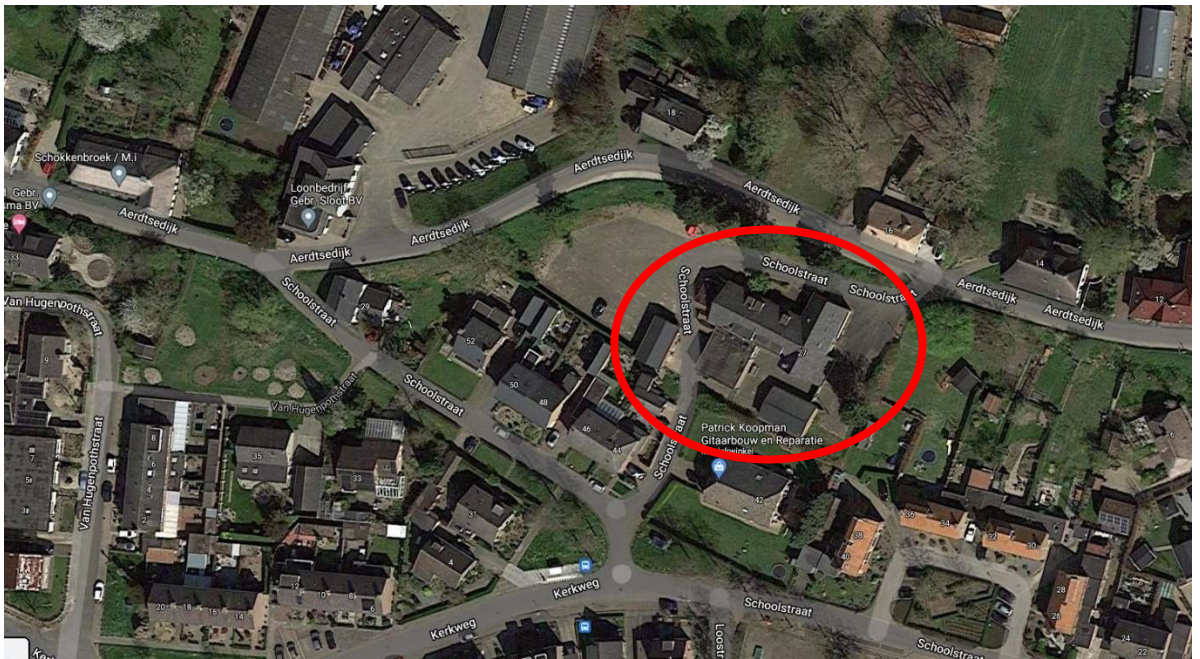
Figuur 2: Ligging planlocatie in Aerdt (binnen rode contour).