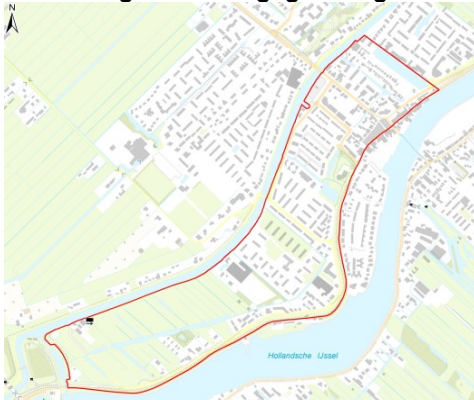
Afbeelding 3 bemalingsgebied gemaal Westeinde

Het gemaal bemalt peilgebieden GPG-125 t/m GPG-128 en maalt direct uit op de Ringvaart. Het bemalingsgebied loopt vanaf de ijsbaan in Moordrecht tot de Snelle Sluis, en is begrensd door de Ringvaart en de Hollandsche IJssel. De polderpeilen van GPG-125 t/m GPG-128 lopen respectievelijk van NAP -2,39 m. tot en met NAP -2,77 m. Voor een overzicht van het bemalingsgebied van gemaal Westeinde zie afbeelding 3. Voor een overzicht van het bemalingsgebied van Oostpolder zie bijlage 1.