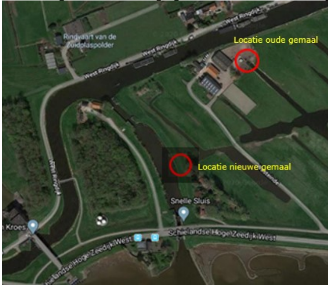
Afbeelding 2: locatie huidige gemaal en locatie nieuwe gemaal

Adres: Schielands Hoge Zeedijk West, 2841 BZ, Moordrecht.