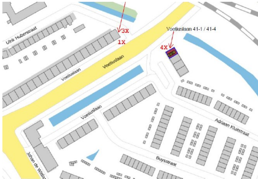
Figuur 1: Locatie 1 tijdelijke mitigatie 2 x 4 vloermuiskasten.