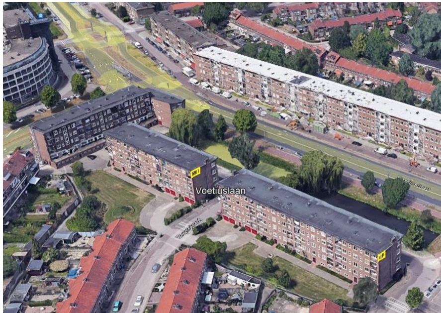
Figuur 3: Locatie extra permanente mitigatie 2 x 4 inbouw-vleermuiskasten, naast de niet-geïsoleerde noord-oostgevel flat 3 en westgevel flat 2 (zie fig. 2; bijlage 2).