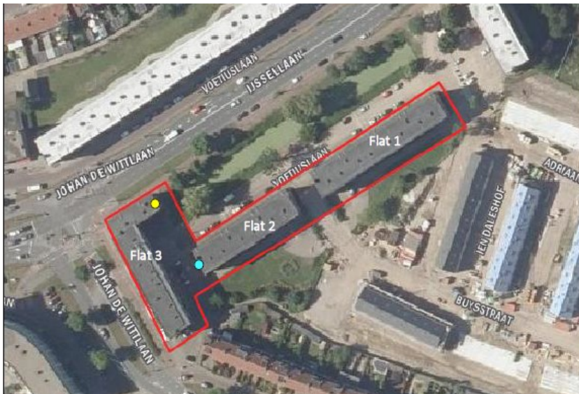
Figuur 1 De drie te renoveren flats in de Voetiuslaan te Arnhem, met in geel locatie grote massawinterverblijf (flat 3) en blauw locatie kleinere winterverblijf (flat 2).