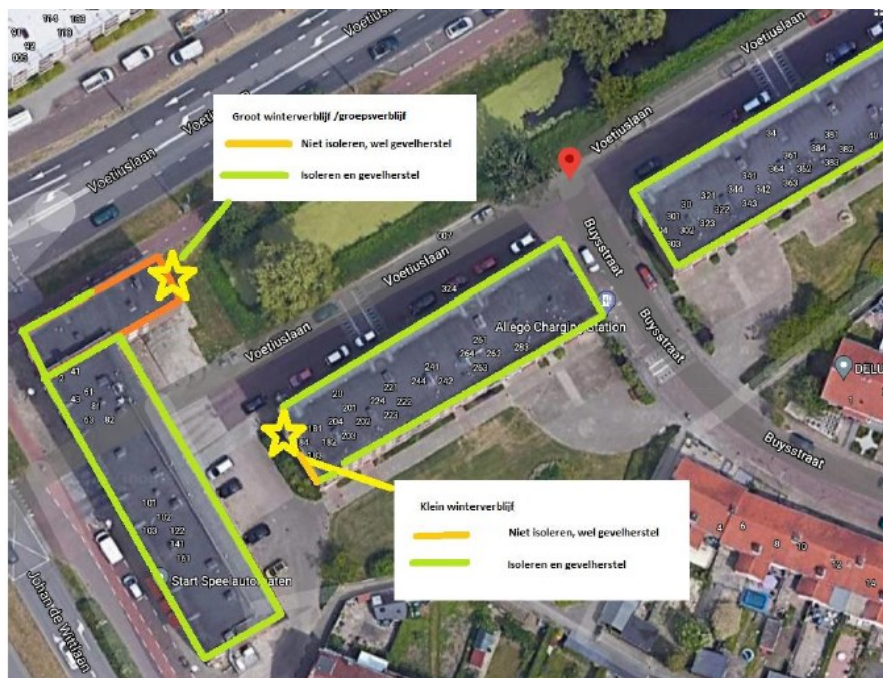
Figuur 2 De drie te renoveren flats in de Voetiuslaan te Arnhem, met de gevels die na de werkzaamheden geschikt blijven als (massa)winterverblijf (oranje).