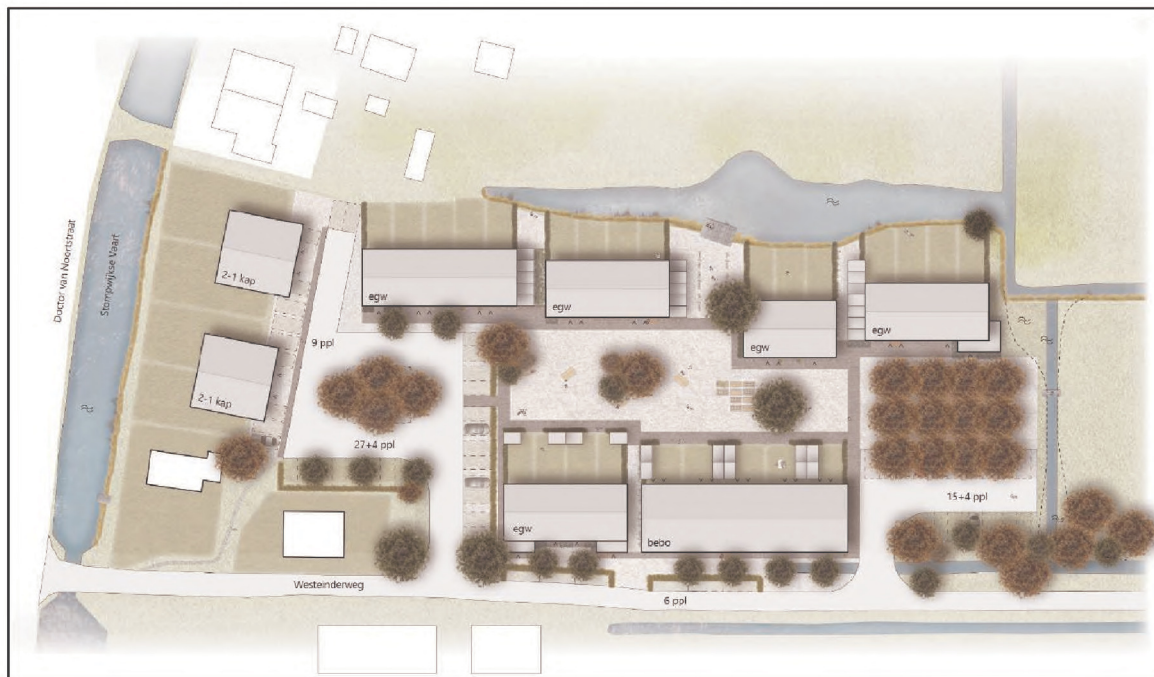
Figuur 1: Globale ligging van de nieuwe woningen

In de onderstaande figuur is de ligging van de woningen weergegeven: