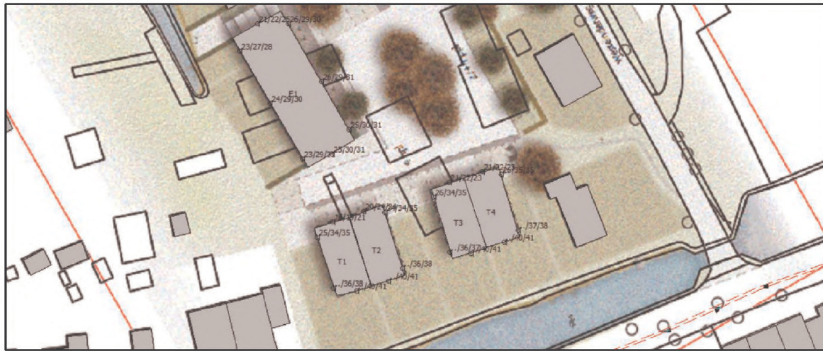
Figuur 4: Geluidsbelastingen afkomstig van de Doctor Van Noortstraat met rondweg

In de onderstaande figuur zijn de geluidsbelastingen ( L_{den} ), inclusief aftrek op grond van artikel 110g Wgh, per verdieping (begane grond/eerste verdieping/tweede verdieping) afkomstig van de Doctor Van Noortstraat met rondweg weergegeven: