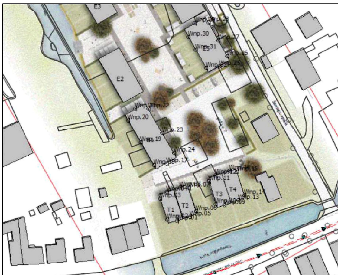
Figuur 2: Nummering van de waarneempunten

Alle berekende geluidsbelastingen zijn weergegeven in bijlage A in tabelvorm. In de onderstaande figuur staat de nummering van de waarneempunten die is gebruikt in het model: