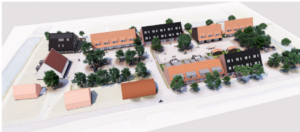
“Bird’s eye view” conform Goede Ruimtelijke Onderbouwing

Het raadsbesluit verklaring van geen bedenkingen maakt integraal onderdeel uit van ons besluit.