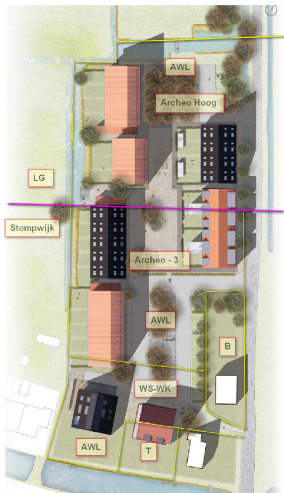
1. 3. 3 Plattegrond nieuwe situatie

De aanvraag is in strijd met het de plaatse geldende bestemmingsplannen "Stompwijk" voor wat betreft het zuidelijk deel en "Landelijk gebied" voor wat betreft het noordelijk deel.