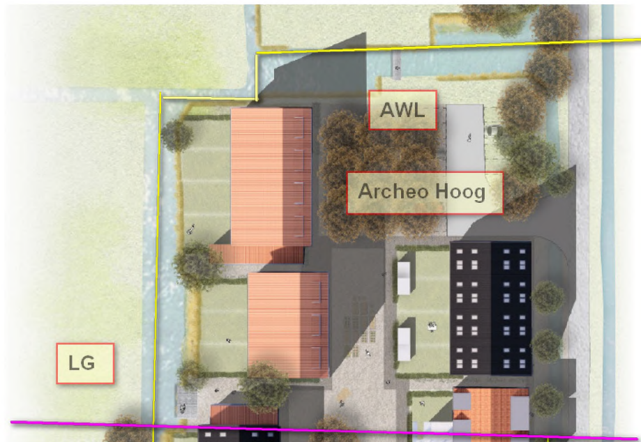
Schematische weergave bestemmingen vanuit plankaart, geprojecteerd op situatie

De aanvraag is in strijd met artikel 6 van het ter plaatse geldende bestemmingsplan "Landelijk gebied" en kan slechts worden vergund met toepassing van een afwijking als bedoeld in artikel 2.12, eerste lid, onder a.3 o , van de Wabo en voor zover de activiteit niet in strijd is met een goede ruimtelijke ordening en de motivering van het besluit een goede ruimtelijke onderbouwing bevat.