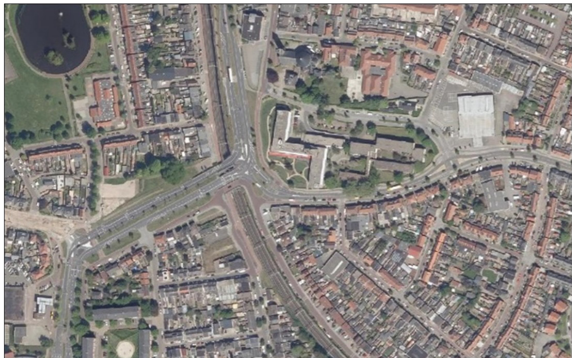
9.6 Bijlage 6: Kaart Salland – Twentetunnel