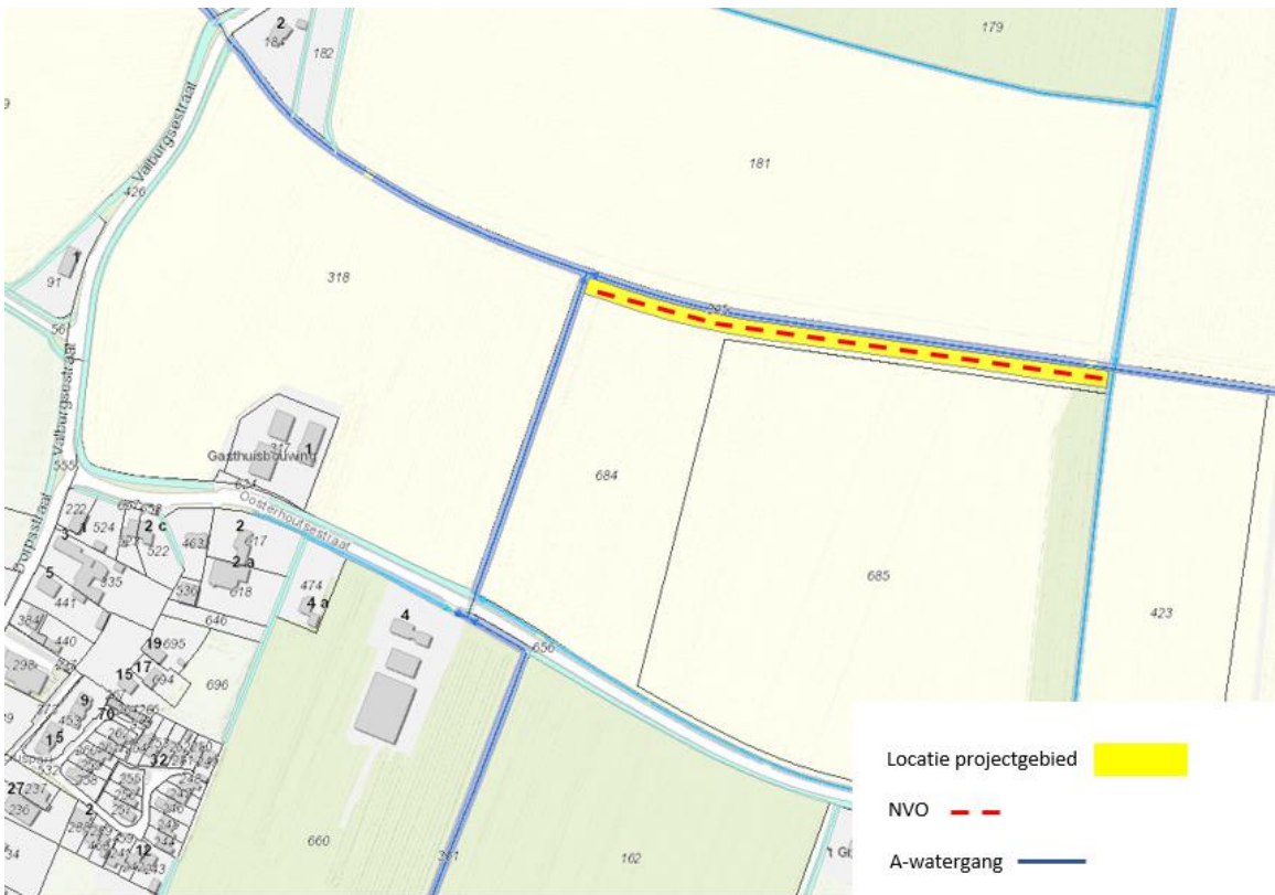
Figuur 2: locatie projectgebied en NVO