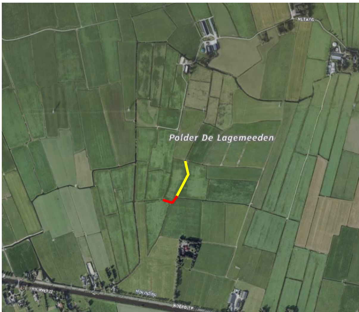
Figuur 2. Ligging plangebied. Geel: Te dempen zijwatergang, 170m. Rood: Te dempen hoofdwatergang, 70m

Binnen het plangebied moeten echter twee nog niet eerder in het plan meegenomen (delen van) sloten worden gedempt, zodat de watergangen beter te onderhouden zijn (betere toegang, verbinding en aaneengesloten onderhoudspaden) en zodat de bedrijfsvoering en opbrengst van de agrarische percelen beter wordt. Het gaat om een te dempen sloot en een deels te dempen sloot in de polder de Lagemeeden (zie figuur 2). De polder maakt onderdeel uit van de NBW-polders, gelegen in het Zuidelijk Westerkwartier. De te dempen sloten zijn niet opgenomen binnen de begrenzing van het plangebied van de reeds verleende ontheffing van 31 juli 2020 en de ontheffing dient hierop dan ook uitgebreid te worden.