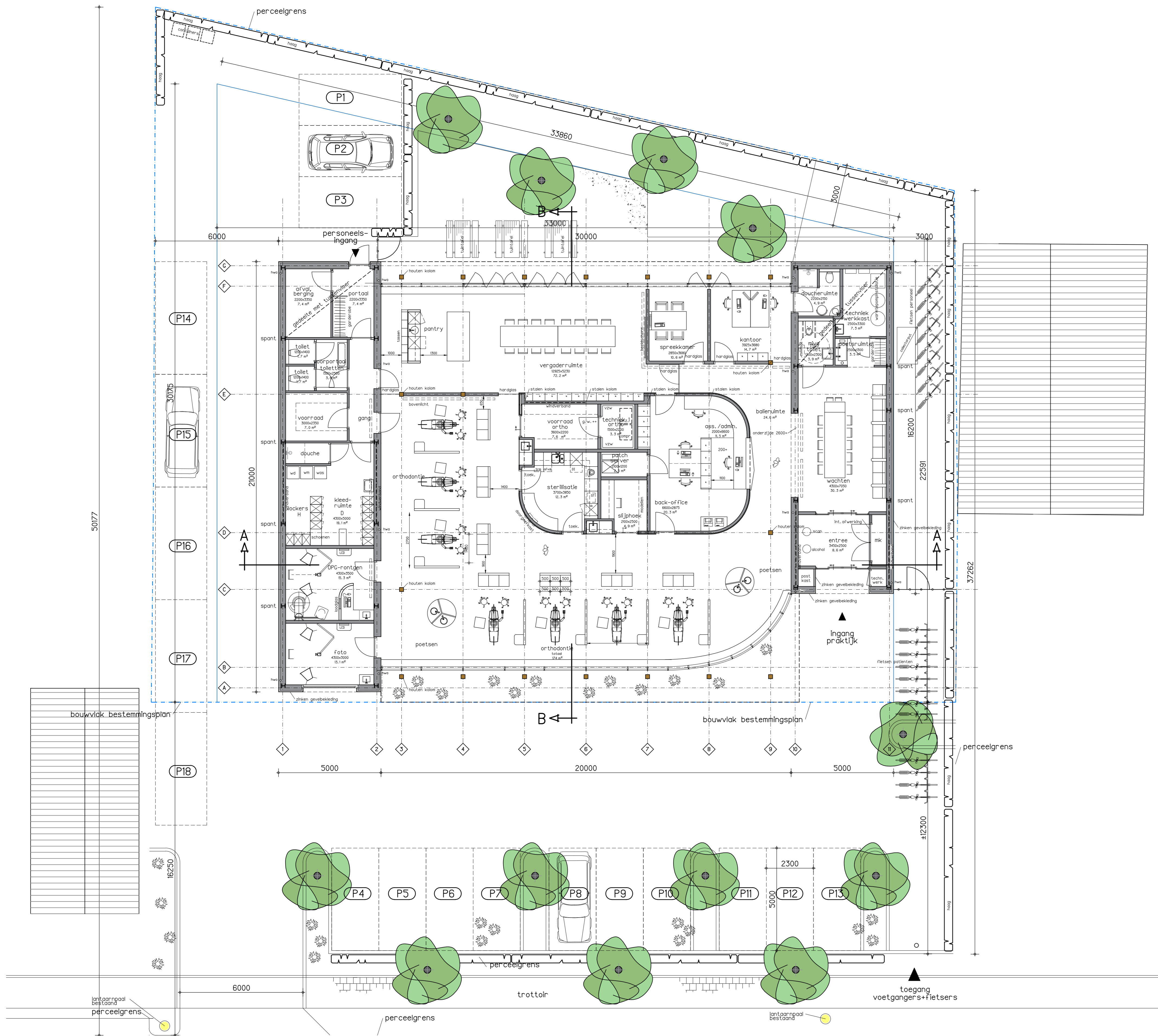
- PLATTEGROND BEGANE GROND - NIEUWE TOESTAND